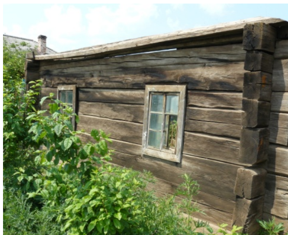
Рисунок 3. Один из первых белорусских домов в деревне Тургеневка Баяндаевского района

обычно обращен на юг, юго-восток, юго-запад и стоит в глубине усадьбы. Это связано с преобладанием данного плана размещения жилищ украинцев на родине (на Волыни).