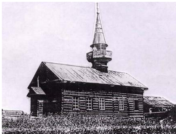
Рисунок 6. Татарская мечеть в селе Залари

Вообще основные отличительные особенности архитектуры строений разных этнических групп проявляются именно в строительстве культовых зданий. Так, на территории области почти в каждом крупном татарском поселке во время реформы появились мечети, построенные татарскими переселенцами.