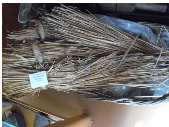
Рисунок 4. Соломенные снопики для покрытия белорусской крыши в этнографическом музее деревни Тургеневка

Со столыпинской реформой связано появление польского села Вершина в Быханском районе Усть-Ордынского Бурятского автономного округа, когда шахтеры Домбровского угольного бассейна (польские земли, входившие в состав России) с семьями стали переезжать в Сибирь. Значительная