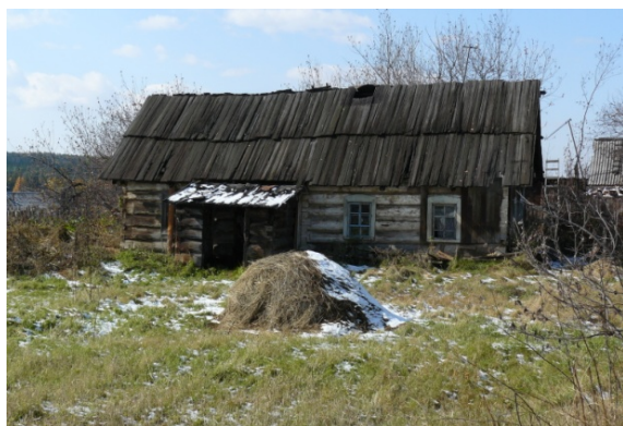
Рисунок 5. Украинский дом в деревне Батама Зиминского района

удаленность Вершины от областного центра и промышленных районов области, а также расположение села в окружении бурятских поселков, материальная и духовная культура которых резко отличалась от культуры переселенцев, позволили сохранить тот пласт реликтов польской культуры, который был привезен с материнской родины. Прежде всего, это касалось интерьера, религии, обычаев. Архитектура польских усадеб в селе Вершина отличительных черт не имеет. Это связано с тем, что «в процессе приспособления переселенцев к новым жизненным условиям ими использовался опыт выживания местных жителей, как бурят, так и русских старожилов. В частности, это касалось обустройства жилищ. За основу была принята та домостроительная традиция, которая сформировалась при освоении Прибайкалья русскими, потом освоенная бурятами. Эту традицию и подхватили польские переселенцы в селе Вершина. Данное обстоятельство объясняется еще и тем, что обычно носителем строительных традиций является крестьянство, а Вершину основали переселенцы-шахтеры» [5, с. 129]. Типичность в домостроении не касается культовых зданий. Каплица – римско-католический костел, построенный в 1915 году в Вершине, – имеет сходство с храмами-каплицами в Польше.