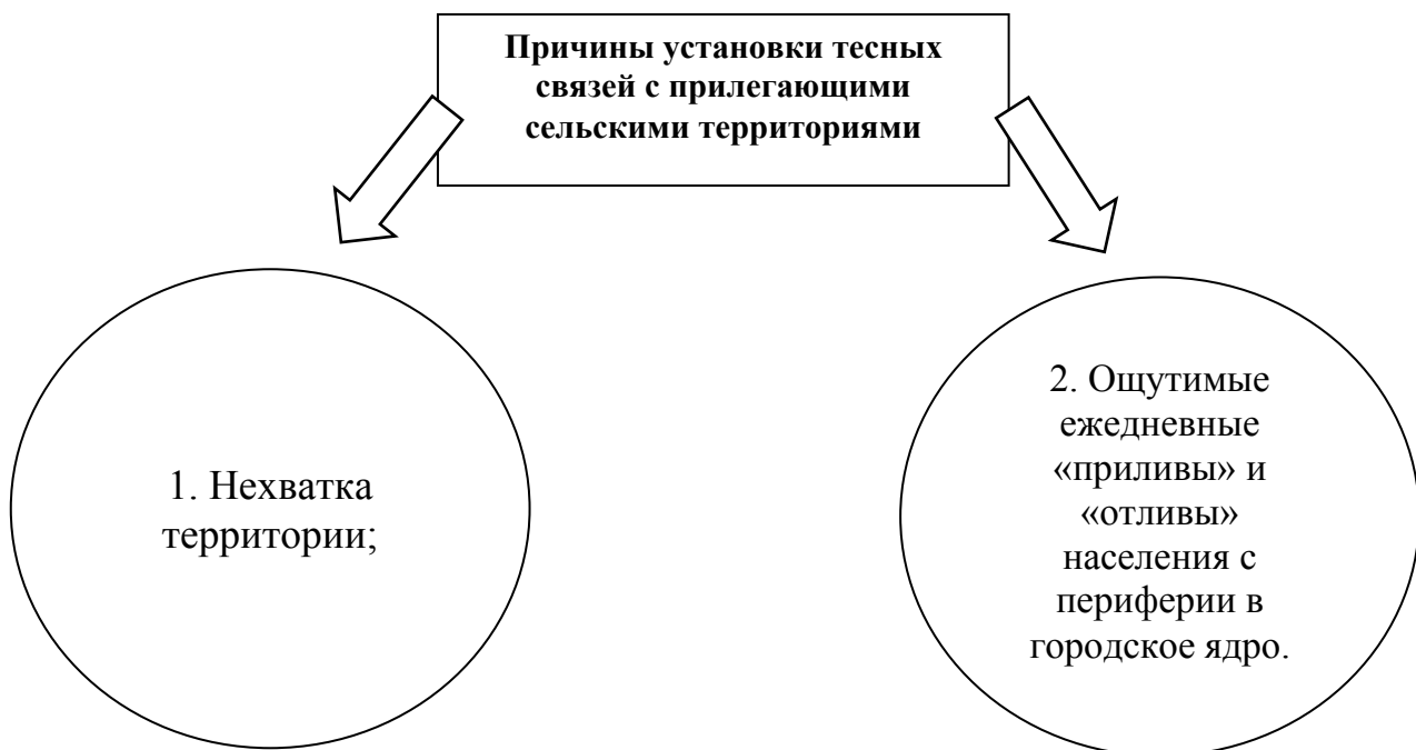
Рисунок 1 - Причины установки тесных связей с прилегающими сельскими территориями.

Увеличение размеров города и рост численности его населения, а также существенное усложнение всей его функционально-пространственной организации сопровождают процесс урбанизации. К характерным чертам любого современного мегаполиса следует отнести высокую компактность, плотность освоения и насыщенность коммуникациями. В то же время, города утрачивают свои четко-определенные границы в связи с тем, что они вынуждены устанавливать более тесные связи с прилегающими сельскими территориями (рис. 1).