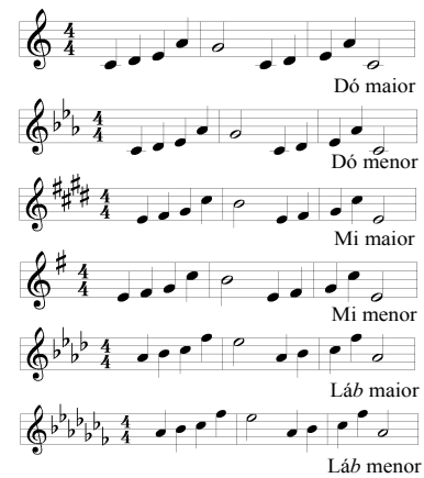
Figura 1. Notação em partitura das melodias musicais utilizadas no procedimento.

Quanto às condições experimentais, essas foram organizadas em função dos estímulos, conforme descrito a seguir: