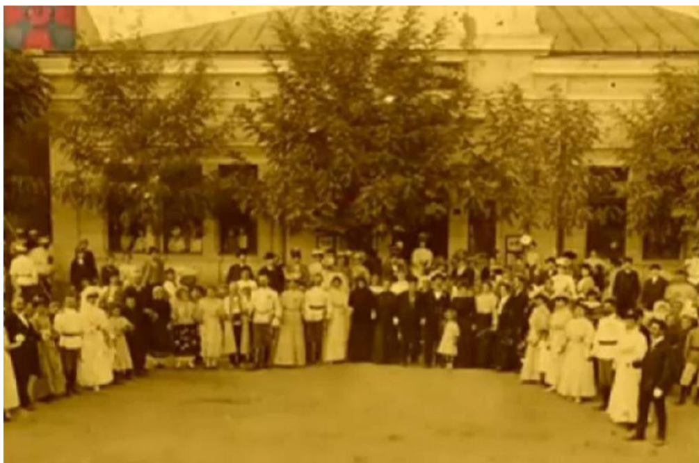
25 септември 1912 г.: пред Военния клуб – обявяване на войната 2)

На 25 септември полкът напусна града тържествено и с добри пожелания изпратен от Белоградчик; милите сцени на скъпа раздяла още повече развълнуваха отзивчивата душа на дружинния командир и в този момент на всенародна надежда той виждаше лъчи на свободата да изгреват над южните предели.