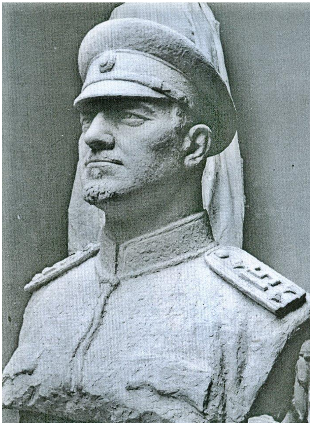
Бюст на полковник Стефан Илиев (профил) 4)