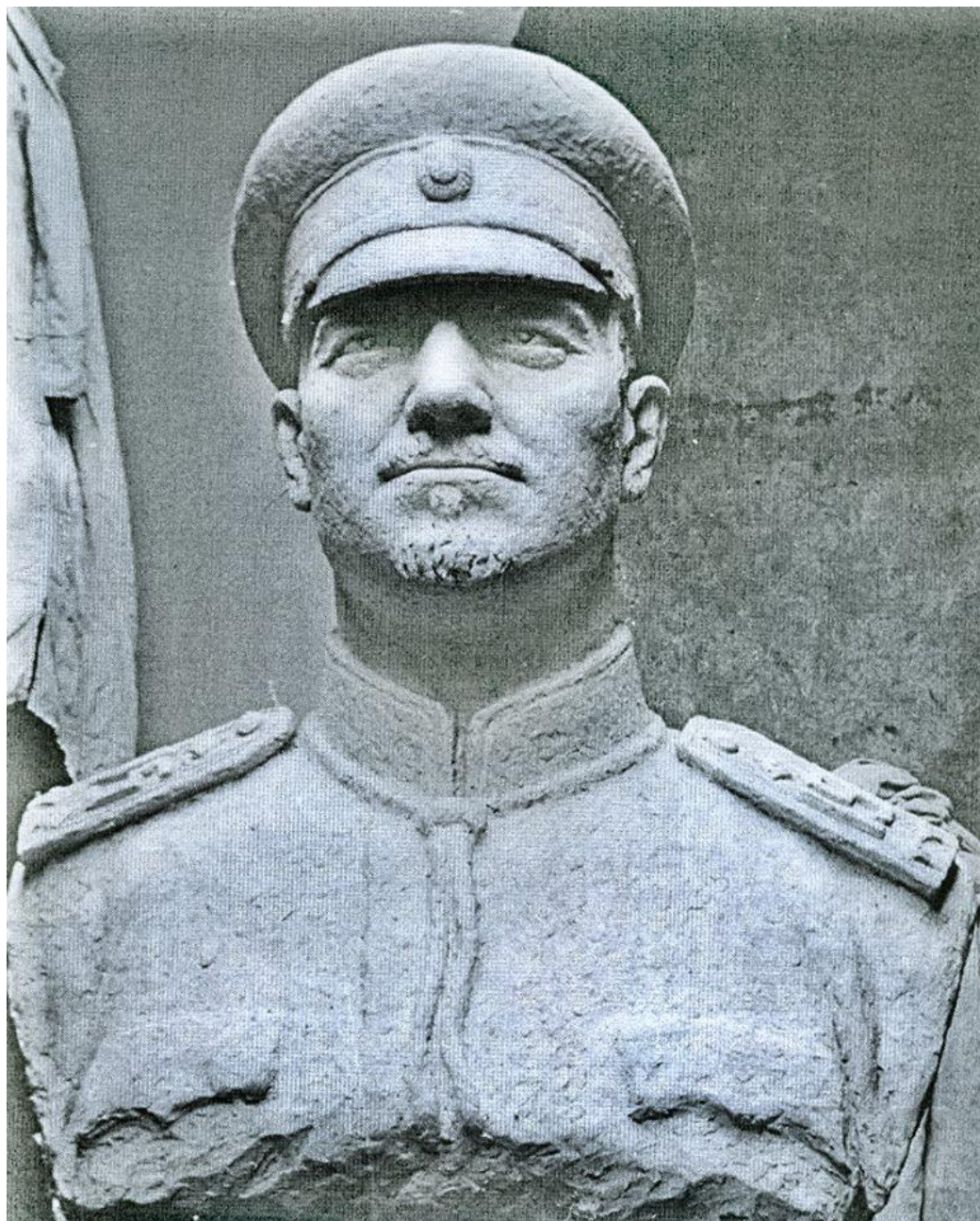
Бюст на полковник Илиев (анфас) 3)