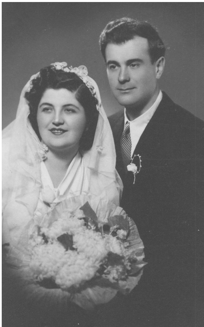
Родителите на Качев

Няколко са сюжетните нишки в тази книга; нишки, които умело се заплитат, преплитат и разплитат. Най-напред това е семейството и неговото влияние върху малкото дете – бабата, дядото, бащата – военният музикант, майката – с техните истории и преживелици. После – далечната семейна връзка, източник на вдъхновение и гордост – Цоло Тодоров, баш кнезът на Белоградчик, ръководителят на Белоградчишкото въстание от 1850 година.