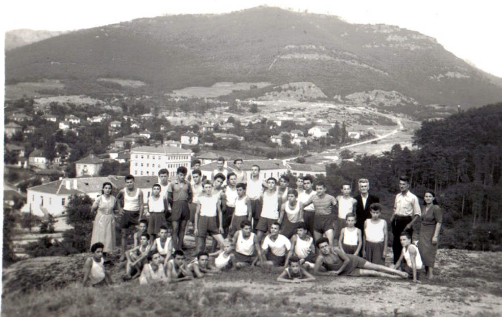
Белоградчик в 50-те години

Комунистическата линия присъства в книгата, но тя е представена вън от възприетия в мемоарната литература шаблон. Дядото на автора споделя комунистическите идеи, но може да потърси и несектантското им изповядване и дори да види възможност за помирение с идеите и практиката на религията. Разработвайки тази линия, Качев дава ясен знак, че тезата за изострянето на класовата борба с преследване на тези, които не следват комунистическите предписания, е източник на беди.