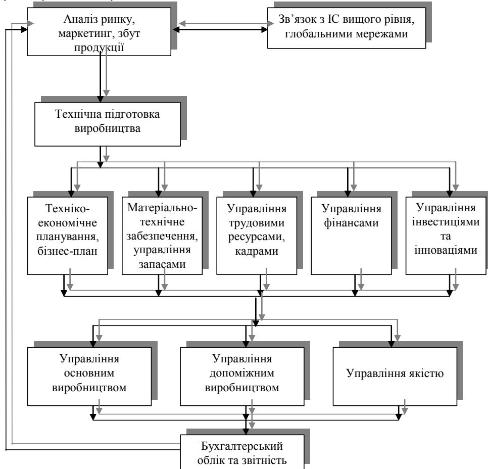
Рисунок 1 – Укрупнена схема інформаційної системи промислового підприємства

максимально використовувати інформацію усіх рівнів управління та усіх підрозділів підприємства [3, 4].