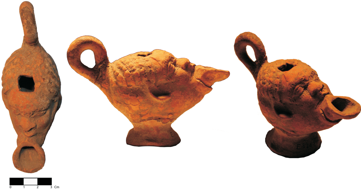
Resim 2: Burdur Müzesi E.8842 No'lu Plastik Kandil