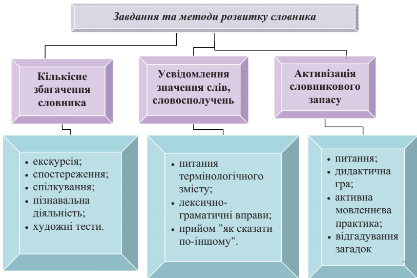
Рис. 2. Карта-схема до теми «Методика розвитку словника»

Наступна карта-схема представляє завдання та методи розвитку словника дітей. Дана карта також може бути використана в декількох варіантах – у ході лекції, присвяченій ознайомленню з даною темою. Сприйняття карти-схеми супроводжується поясненнями викладача. У зміненому вигляді карту можна використовувати для практичних занять та проведення модульного контролю: фрагменти карти можна переставити місцями, щоб студенти з'єднали завдання з відповідними методами; студенти можуть заповнити карту, в якій будь-який фрагмент має закритий вигляд тощо.