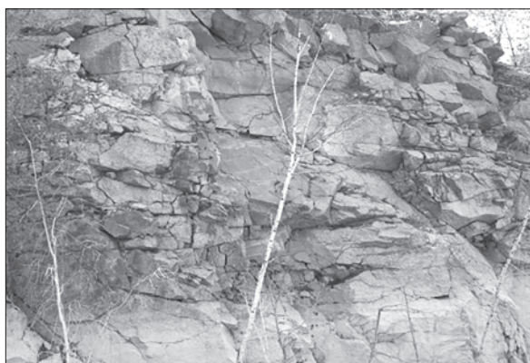
Рис. 2. Ольшаницький кар'єр, південний борт. Ксеноліти плагіограніту в порфіроподібному граніті Fig. 2. Olshanytsia quarry, south side. Xenoliths of plagiogranite in porphyry-like granite

Fig. 3. Olshanytsia quarry, south side, fragment of plagiogranite body (sample RT-5-1) dissected by granite vein bodies: a — general view, b — sampling area RT-5-1