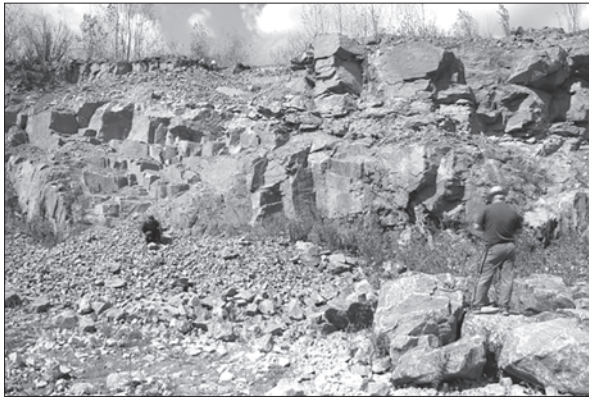
Рис. 1. Острівський кар'єр, східний борт, виходи порфіроподібного граніту (пр. RT-1-1), серед плагіогранітоїдів та амфіболітів

Fig. 1. Ostrivsky quarry, backboard, porphyry-like granite outcrops (RT-1-1 test), among plagiogranitoids and amphibolites