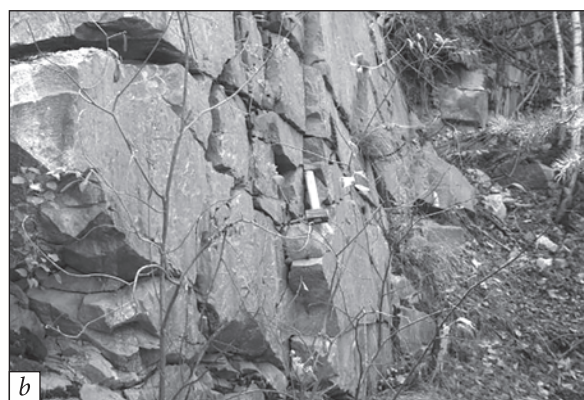
Рис. 3. Ольшаницький кар'єр, південний борт, фрагмент тіла плагіограніту (пр. RT-5-1), розсічений жильними тілами гранітів: а — загальний вигляд, б — ділянка відбору пр. RT-5-1

Fig. 3. Olshanytsia quarry, south side, fragment of plagiogranite body (sample RT-5-1) dissected by granite vein bodies: a — general view, b — sampling area RT-5-1