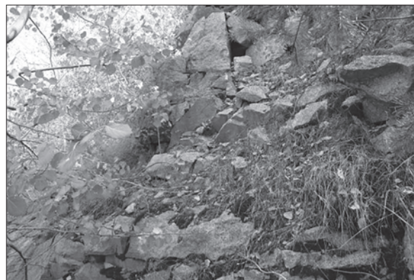
Рис. 4. Ольшаницький кар'єр, південний борт, виходи порфіроподібного граніту, орієнтовно 10 м східніше фрагмента (рис. 3). Ділянка відбору пр. RT-5-2

Мінеральний склад (об'ємн. %): калієвий польовий шпат — 30—34, плагіоклаз — 32—35, кварц — 30—35, біотит — менше 5. Із ак-