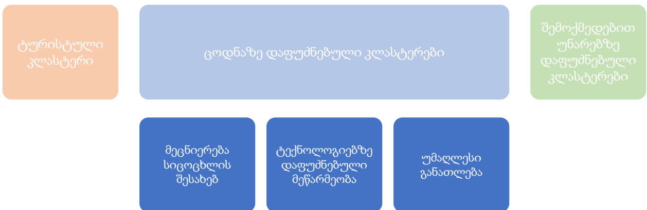
დიაგრამა 2. იერუსალიმის ზრდის დღის წესრიგი (დაფუძნებული კლასტერულ მიდგომაზე: Porter, 2015)

საქართველოში ბიზნესის მიერ ინოვაციების გამოყენების შესაძლებლობები საკმაოდ შეზღუდულია. 2018 წლის მონაცემებით, ქვეყანას ინოვაციების გლობალურ ინდექსში 100 ქულიდან მინიჭებული აქვს 35,05 ქულა (Cornell..., 2018), რაც აღემატება 2016 წლის ანალოგიურ მაჩვენებელს (33,9 ქულა) და 126 ქვეყანას შორის უკავია 59-ე ადგილი.