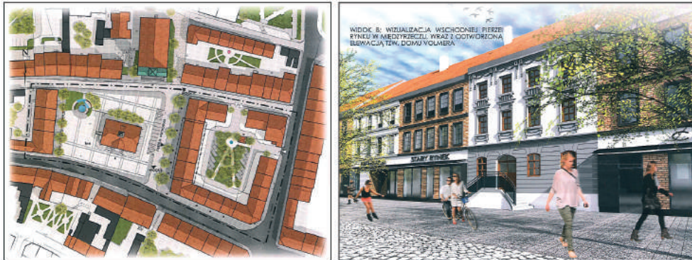
Rys. 3. (po lewej) Zagospodarowanie terenu wokół Starego Rynku; (po prawej) projekt wschodniej pierzei Rynku z repliką elewacji domu J. J. Volmera. Rys. Ilona Pisera

Zabudowę tego kwartału mają tworzyć trzykondygnacyjne domy, o funkcji mieszkaniowej z usługami w parterach, kryte wysokim dachem, o współczesnych formach, materiałach i detalu. Ciąg kamienic nowo projektowanej pierzei urozmaicono cytatem z historycznej architektury, odtwarzając, na podstawie archiwalnej dokumentacji, klasycystyczną elewację stojącego tu niegdyś domu należącego do kupca J.J. Volmera. (Rys. 3, po prawej). Kamienicę tę nazywano też „domem Napoleona”, ponieważ cesarz Francuzów stacjonował tu na początku XIX wieku, w swoim marszu na Wschód. Dyspozycja wnętrza i konstrukcja kamienicy Volmera zostały rozwiązane zgodnie ze współczesnymi wymogami zabudowy, odtworzona elewacja stanowi jedynie ozdobną aplikację, nawiązującą do historii miejsca. Do pamięci miejsca odnoszą się także nazwy nadane lokalom usługowym w trzech kamienicach tej pierzei, jak: „Restauracja Stary Rynek”, „Kawiarnia Volmer” i Cukiernia Napoleon”.