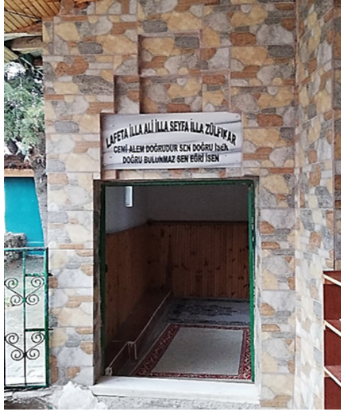
Şekil 3: Keçeci Baba Türbesi