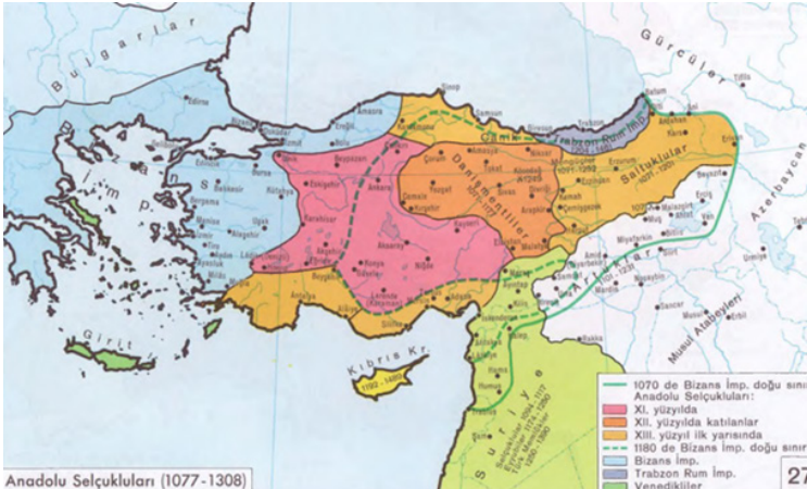
Şekil 2: Anadolu Selçuklular Döneminde Anadolu (Unit, 1992, 27)

Sözlü kaynaklara ve köydeki Ocak dedelerine göre Ahi Mahmud Veli, Horasan bölgesinde Nişabur'da doğmuş (Pehlivan, 2002) ve 13. yüzyılda Horasan'dan Anadolu'ya gelmiştir. Danişmentliler havzasında (Şekil 2) kurulup edep- erkân süren Keçeci Baba Ocağındaki Ocakzade dedeler, Keçeci Baba'nın Hacı Bektaş Veli'nin amcası olduğunu, 1349 senesinde Anadolu'da şehit düşüğünü ifade etmektedirler. Tepecik'in Keçeci Baba Türbesi'ndeki sancağındaki yazıdan okuduğu üzere, "Keçeci Baba'nın Ali Haydar, Altunbıyık ve Seyyid Mehmed isminde üç oğlu olduğu" görülmektedir (Tepecik, 2019, 29).