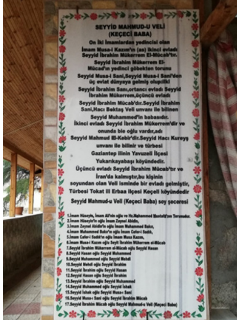
Şekil 1: Keçeci Baba'nın Türbede Mevcut Olan Şeceresi