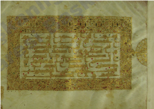
Şekil 3: TMSK 2 nr. mushaftan bir sayfa; 3b: el-Fatiha 1/1-5. ayetler.

“Kelam-ı Kadim. Kabı zeytunî renk meşin olup yeşil atlasla kaplanmıştır. Levhaları Arap işi süslüdür. Diğer iki levhasında “el-Fâtiha” suresi ile “el-Bakara” suresinin başlangıcı yıldızla yazılmıştır. Sure başları yıldızlıdır. 411b ve 412a varaklarında “İmam Ali” yazısı olduğuna dair ibareler vardır. 412a sayfasından itibaren beş sayfa 307 tarihinde Abdullah bin Mehmet adlı kâtip tarafından yazılmıştır. Mahfazalıdır.”