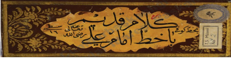
Şekil 4: TMSK 2 nr. mushaf miklebi: ١٦ سطر رضي الله تعالى سطر ٦١

Mushafın miklebinde “كلام قديم بخط كوفي بخط علي رضي الله تعالى سطر ٦١” yazmaktadır: “Kûfî hatlı Ali'nin (r.a) hattı ile kelam-ı kadim. 16 satır.”: