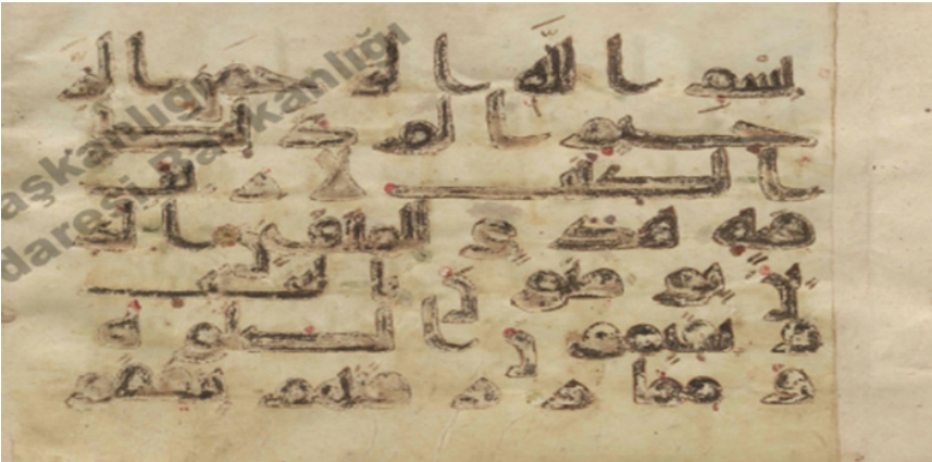
Şekil 5: TMSK 29 nr. mushaftan bir sayfa: 4b; el-Bakara 2/1-3. ayetler.

“Parşömen, 123mm boy, 183mm eninde cönk biçiminde 147 yaprak. Sahifede Hicri 2/3. asır küfisiyle 140mm uzunluk 7 satır bulunmaktadır. Sonunda yıldızla yapılmış geçmeli iki levha vardır. Kahverengi deri cilde sahiptir. Kur'an'ın başından el-Bakara suresinin 2/266. ayetinin sonuna kadar olup “لَعَلَّكُمْ تَتَّقُونَ” kelimesiyle bitmektedir.” (Karatay, 1962, 14).