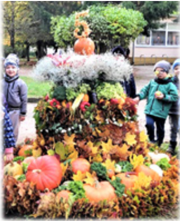
Moliūgo gimtadienio tortas