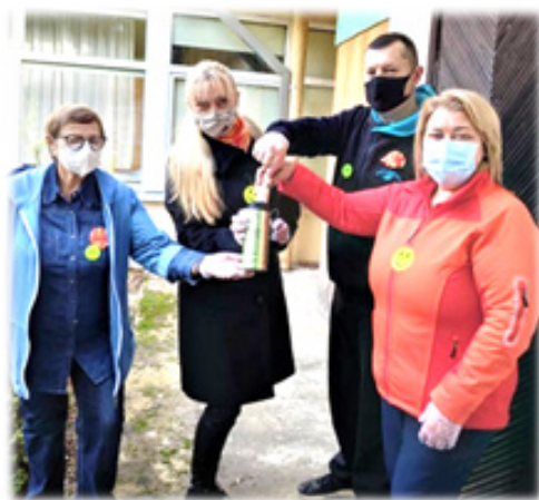
EKO laiko kapsulė