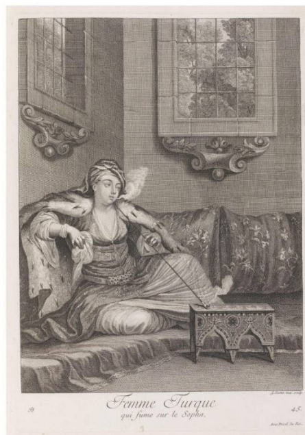
Рис. 2 Гравюра, естамп. № 45 «Турчанка, яка курить». Жан Батіст Ванмур гравер Жан Батіс Скотін I. 1714–1715 рр.

Так, першою трансформацією згаданих творів Ж. Б. Ванмура у фарфорі стали вироби Майсену першої половини XVIII століття. Перші фігурки турків і турчанок у колоритному екзотичному вбранні були змодельовані у 1740-х роках провідним майстром Майсену – Й. Кедлером, а згодом і його помічником Фрідріхом Еберляйном [3]. Означені керамісти апелювали до німецької версії гравюр згаданого французького художника, які згодом відтворили у твердому фарфорі. Колорит цих фігурок також був не випадковим, адже у доробку Ж. Б. Ванмура, як вище зазначено, були й живописні картини, які демонструють усю кольорову палітру національного вбрання, його декорування і найдрібніші аксесуари.