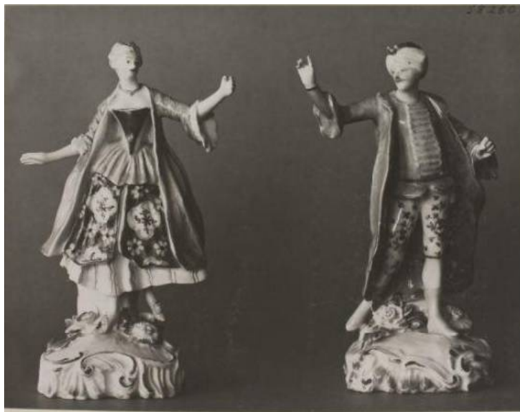
Рис. 3. Пара турецьких танцюристів у театральних костюмах. М'який фарфор, розпис емалевими фарбами. Дербі, 1760 р.

мотивів декорування. Тобто, художні риси цієї частини світу, окрім згаданих фігурок, почали з'являтися у сюжетних розписах, зокрема у контексті прославляння власних колоніальних здобутків або як чогось небаченого й екзотичного [8, 9].