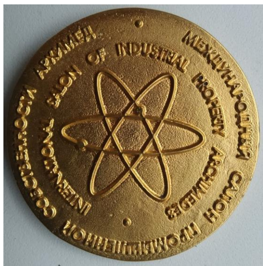
Рис. 4. Золотая медаль международного салона промышленной собственности «Архимед» (Москва)