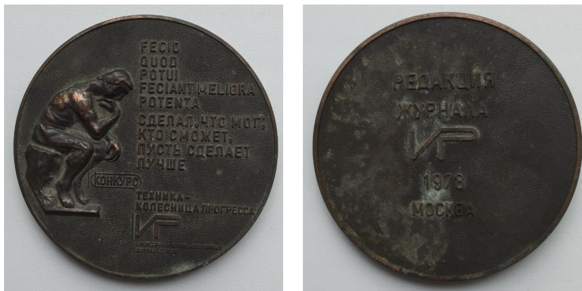
Рис. 2. Медаль конкурса «Техника – колесница прогресса» (Москва, 1978)

Павлу Ивановичу также удалось устранить коробление ценной хвойной древесины – курильской лиственницы и камчатской ели – при интенсивной сушке, отчего пятая часть замечательного пиловочника шла на третьесортные поделки. Созданное им устройство прекрасно работало в деревообрабатывающем цехе, правда, в одном экземпляре, хотя был акт комиссии, рекомендующий снарядить таковыми все сушильные камеры (Егоров, 1985: 14).