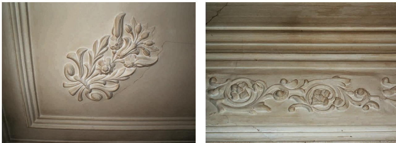
Рис. 3-8. Образцы лепного декора в доме Леляковых по ул. Ленина, 49