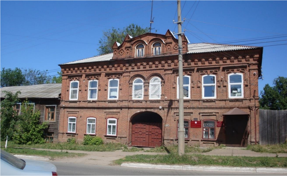
Рис. 2. Дом Леляковых по ул. Ленина, 49 Фото автора, 2017