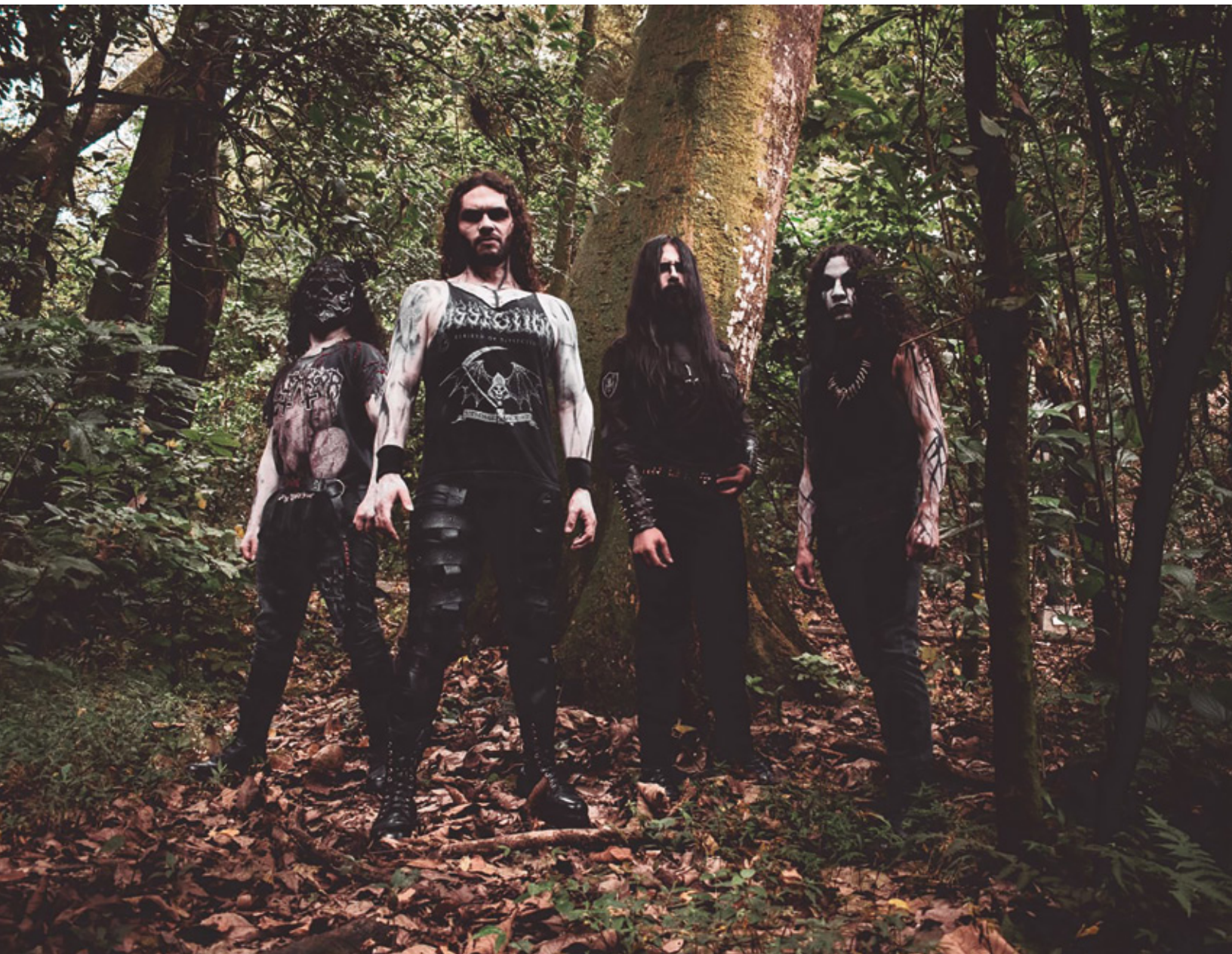
Imagen 2. Vitam Et Mortem