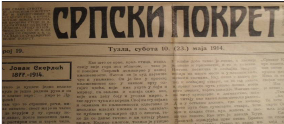
Prilog 1. Naslovnica lista "Srpski pokret" štampanog u Tuzli.

U kontekstu obrađivane teme vrlo je značajan za analizu sedmični, tuzlanski list "Srpski pokret", koji je počeo izlaziti 1913. godine.