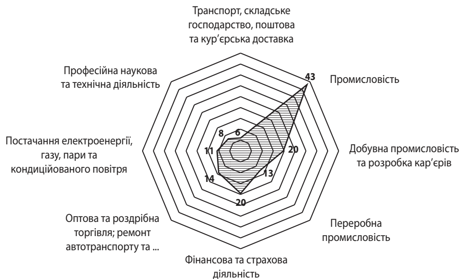
Рис. 3. Прямі іноземні інвестиції в Україну в розрізі окремих галузей економіки, 2019 р.

На особливу увагу заслуговує збільшення частки «Професійна наука та технічна діяльність» – до 8 %, цього показника вдалось досягти за рахунок ІТ-сфери, саме в неї, за підрахунками щорічного дослідження венчурного ринку України DealBook 2020, в Україну за 2019 р. було залучено понад 544 млн дол. США, що на 199 млн дол. США, ніж у 2018 р. Основними інвесторами для українських стартап-компаній стали міжнародні фонди Iconiq Capital, General Catalyst, Goldman Sachs VC [15].