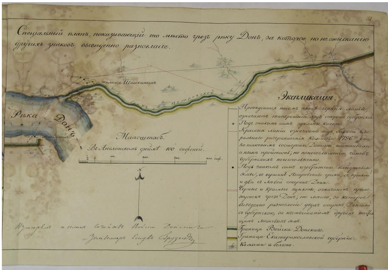
Рис. 3. Карта, поясняющая конфликт между войсковым и ростовским землемерами (ГАРО. Ф. 46. Оп. 1. Д. 484. Л. 81)

Несмотря на все это, войсковая канцелярия продолжала свою прежнюю политику, направленную не столько на решение проблем, сколько на раздувание конфликта с не выполняющими ее постановления екатеринославскими чиновниками. В январе 1835 г. она разобрала события октября прошлого года, игнорируя события ноября и то, что сама граница, как стало ясно, должна была быть определена заново. Действия генерала Кирсанова оказались всецело одобрены, а екатеринославские чиновники были названы «уклонившими себя без законных причин» от дела уточнения границы (ГАРО. Ф. 46. Оп. 1. Д. 484. Л. 73об.-74). Войсковая канцелярия снова в одностороннем порядке постановила начать новый этап размежевания 10 мая 1835 г. во все той же Елисаветовской станице, а екатеринославским чиновникам приказала явиться в это время на нужное место (ГАРО. Ф. 46. Оп. 1. Д. 484. Л. 74). Кроме того, Кирсанов доложил начальству о «неуважении к чиновничеству» со стороны ростовского заседателя, а войсковая канцелярия обратилась в правительствующий сенат, чтобы он наказал екатеринославские власти (ГАРО. Ф. 46. Оп. 1. Д. 484. Л. 74-74об.). Более разумно действовал землемер Груднев, представивший свои соображения по поводу разночтений в деле проведения границы (ГАРО. Ф. 46. Оп. 1. Д. 484. Л. 81). Мы не будем приводить их технических деталей, вместо этого приложив архивную карту, из которой ясно видно: землемеры не сошлись в вопросе о том, кому должна принадлежать часть богатого рыбой устья Дона.