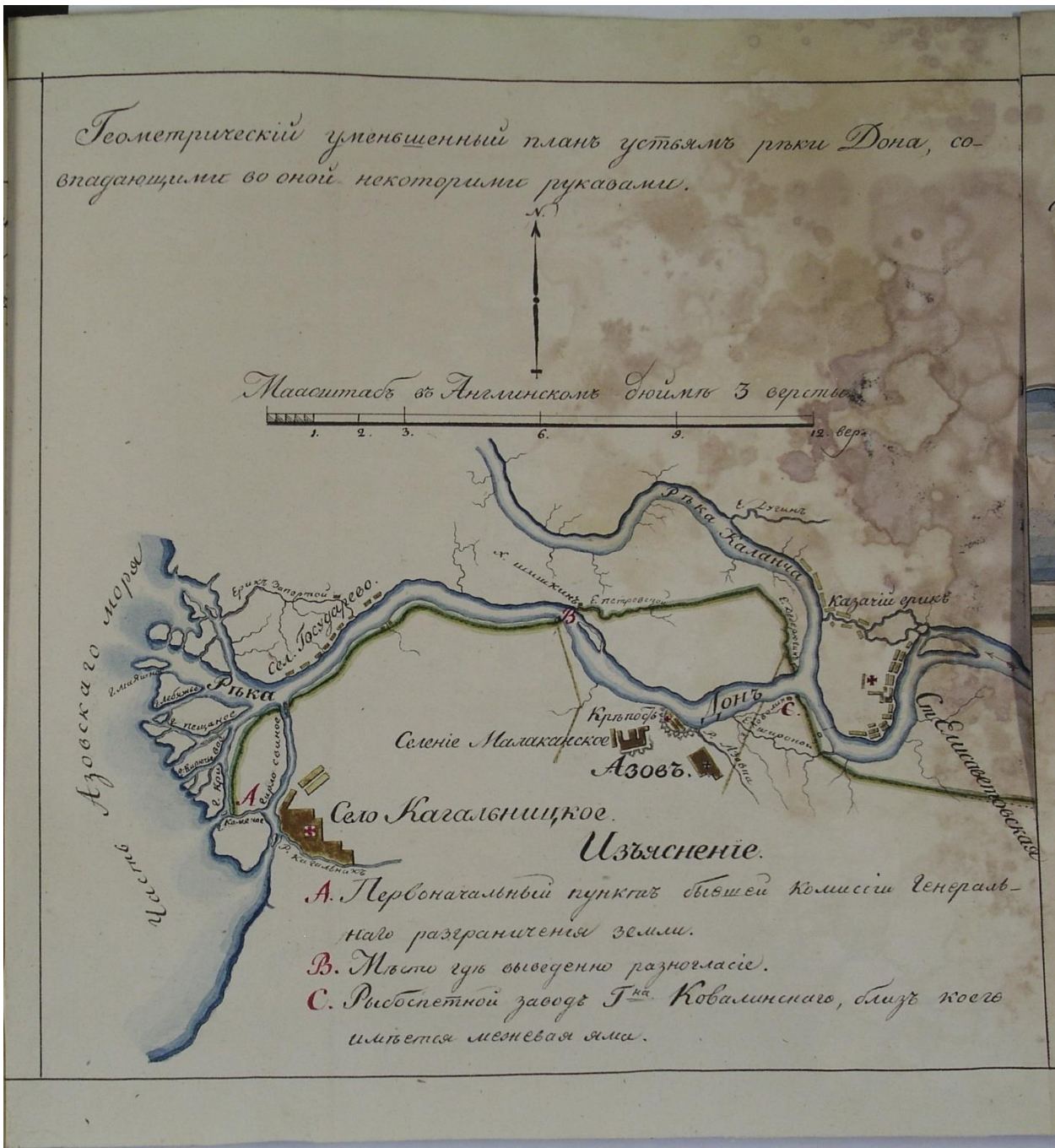
Рис. 1. Карта спорных земель (ГАРО. Ф. 46. Оп. 1. Д. 484. Л. 81)