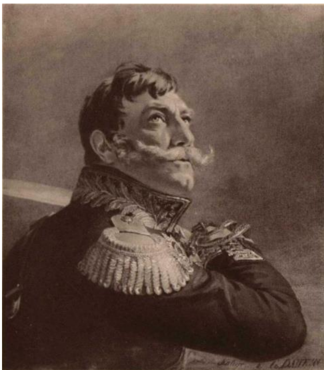
Рис. 2. Генерал от кавалерии, наказной атаман и кавалер Дмитрий Ефимович Кутейников (Военная галерея 1812 года. СПб., 1912. С. 37)

Обострить ситуацию хотели скорее донские низовые чиновники, особенно хорунжий Беспалов, 11 ноября 1833 г. подавший атаману рапорт. В его интерпретации выходило, что с 1818 г. войсковые власти пытаются защитить казачьи довольствия от использования крестьянами устья Дона, и только неявка екатеринославских чиновников препятствует этому благому делу (ГАРО. Ф. 46. Оп. 1. Д. 484. Л. 34). Правда, даже из текста его рапорта становится ясно, что ситуация была не столь однозначной и, возможно, прежняя неторопливость местных властей в деле размежевания была связана и с личной выгодой. Во всяком случае, как сообщал Беспалов, многие казаки и калмыки соглашались пускать крестьянский скот на выгоны под видом своего, получая за это от одного до десяти рублей (очевидно, в год) (ГАРО. Ф. 46. Оп. 1. Д. 484. Л. 34об.). Екатеринославские власти согласились и с этим обвинением: 8 декабря 1833 г. года лично Н.М. Лонгинов признал факт использования крестьянами казачьих земель и в очередной раз заверил Д.Е. Кутейникова, что просьба помочь и принять меры отправлена во все соответствующие инстанции, включая ростовский суд и азовскую посадскую ратушу (ГАРО. Ф. 46. Оп. 1. Д. 484. Л. 37-37об.).