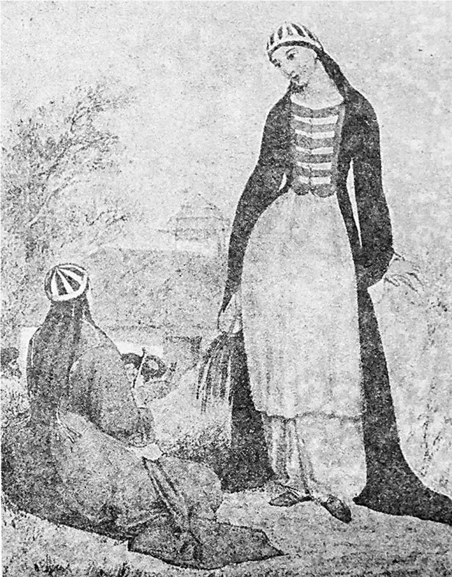
Рис. 1. «Черкешенки в изображении европейских авторов XVIII–XIX вв.» (Сукунов, Сукунова, 1992 – online: kavkaz-history.ru/sukunov-h-h-sukunova-i-h-cherkeshenka/34/ )

черкешенках и описаний русских, европейских и восточных авторов, восхищенных их изяществом и грацией, собрали адыгейские ученые (см.: Сукунов, Сукунова, 1992).