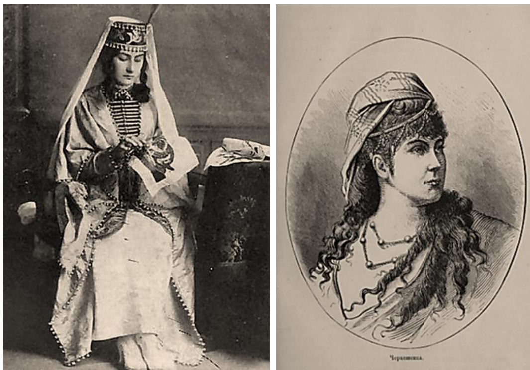
Рис. 2. «Черкешенки»

(слева: https://topwar.ru/153925-rascvet-i-zakat-rabotorgovli-na-chernomorskom-poberezhe-kavkaza-chast-1.html ; справа: Швейгер-Лерхенфельд, 1885: 17)