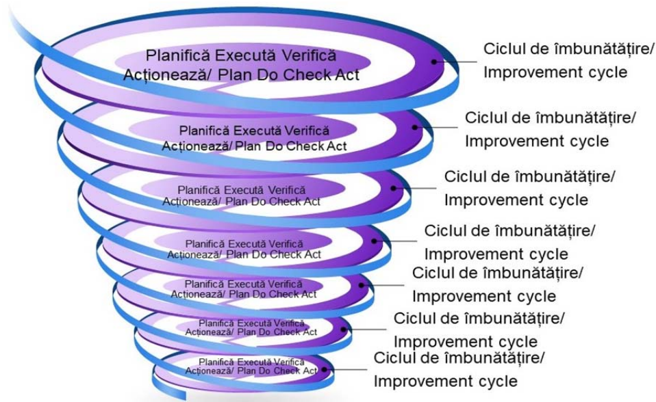
Figura 2. Spirala Deming/ Figure 2. The Deming Spiral