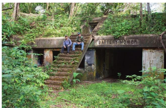
Figura 2. Vista de la Battery Mower, en Fort Sherman, año 2016.