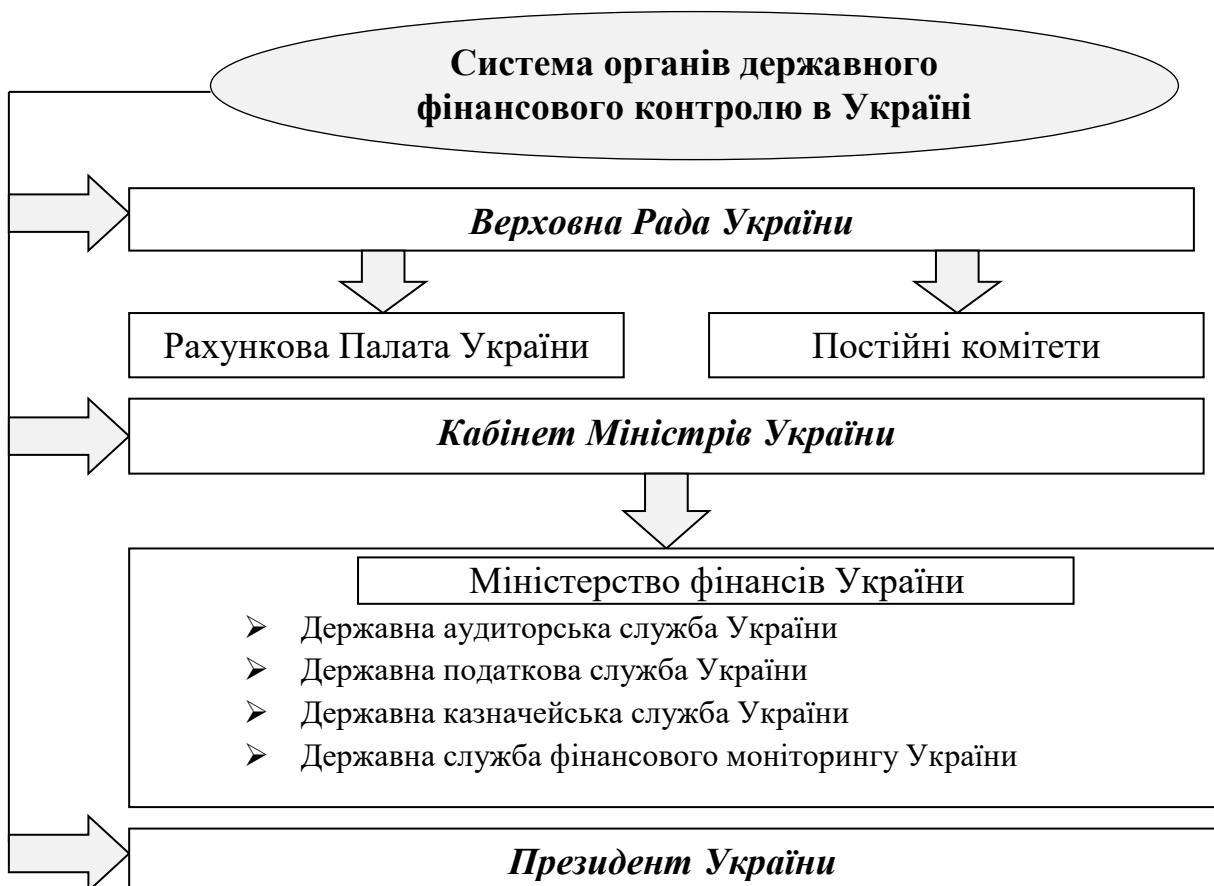
Рис. 1. Система органів державного фінансового контролю в Україні

Управління фінансами в державі здійснюється через систему державних органів та інститутів за допомогою форм і методів організації управлінської діяльності. Органи, що здійснюють фінансовий контроль, утворюють систему, що складається з трьох основних груп: органи, що здійснюють загальнодержавний контроль (Верховна Рада України, Кабінет Міністрів України); органи відомчого фінансового контролю (Міністерство фінансів України); органи, що здійснюють незалежний фінансовий контроль (аудиторські організації) (рис. 1).