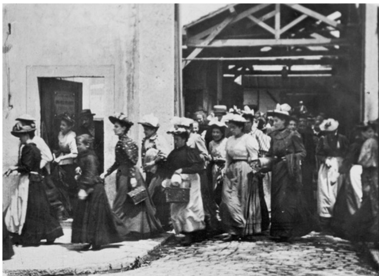
Trabalhadores saem da Fabrica Lumière, Luis Lumière, 1895.

A resposta conservadora ao êxodo de filmes políticos (ou de videoinstalações) para o museu é assumir que eles estão perdendo sua relevância. É lamentável ver esses filmes hospedados na torre de marfim burguesa e transformados em alta cultura. Igualmente lastimável é constatar a produção de trabalhos já pensados para serem instalados dentro de um cordão sanitário elitista, que os separa da «realidade». Na verdade, quando Jean-Luc Godard diz que artistas de videoinstalação não deveriam estar com «medo da realidade», naturalmente assume que eles de fato estão. 6