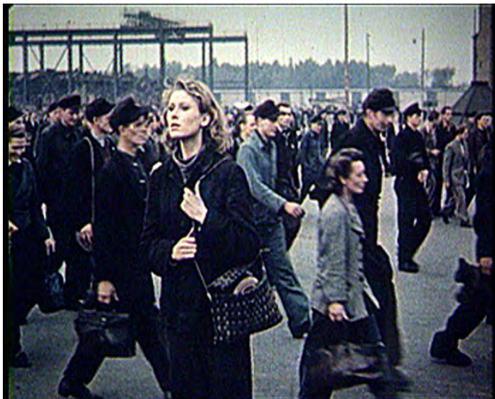
Harun Farocki, Trabalhadores saindo da fábrica em onze décadas, 2006. Frame do vídeo.