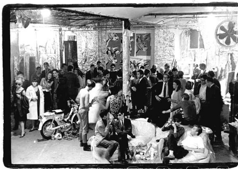
Silver Factory de Andy Warhol