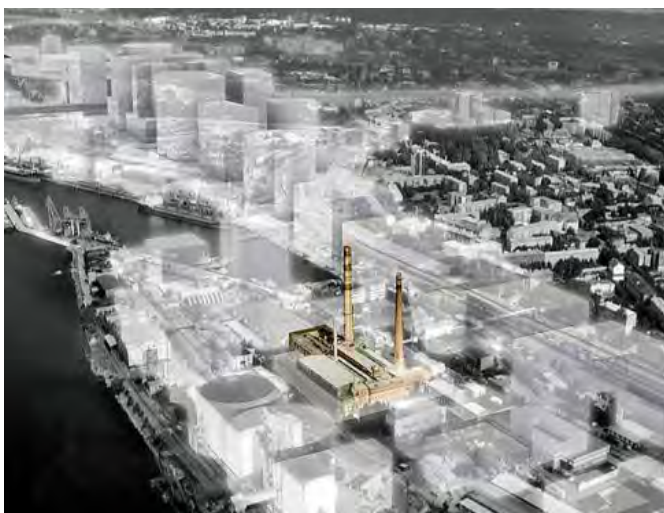
Diagrama (OMA) para o Museu de Arte Contemporânea de Riga, 2006.