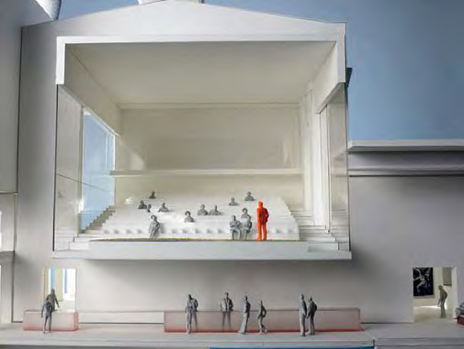
Maquete do Museu de Arte Contemporânea Garage (OMA), a ser construído em uma usina desativada de Moscou, 2006.