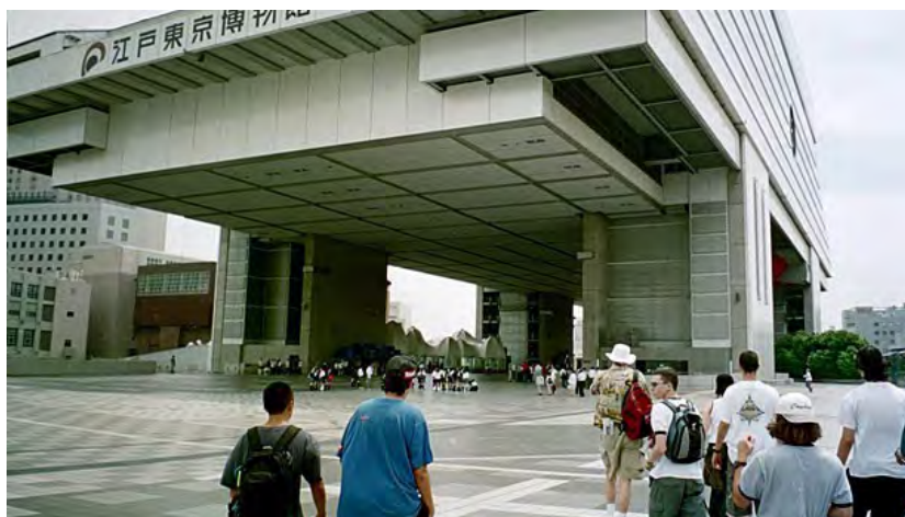
Visitantes entrando no Edo-Tokyo Museum, 2003.