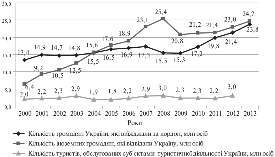
Рис. 4. Порівняльна динаміка туристичних потоків в Україні у 2000–2013 рр.

розміщення туристів в Україні, які є дешевшими порівняно з готелями (за даними Державної служби статистики, в Україні у 2011 р. налічувалося 3162 готелів та 2720 спеціалізованих засобів розміщення, у 2012 р. – 3144 готелів та 2897 спеціалізованих засобів розміщення) [4].