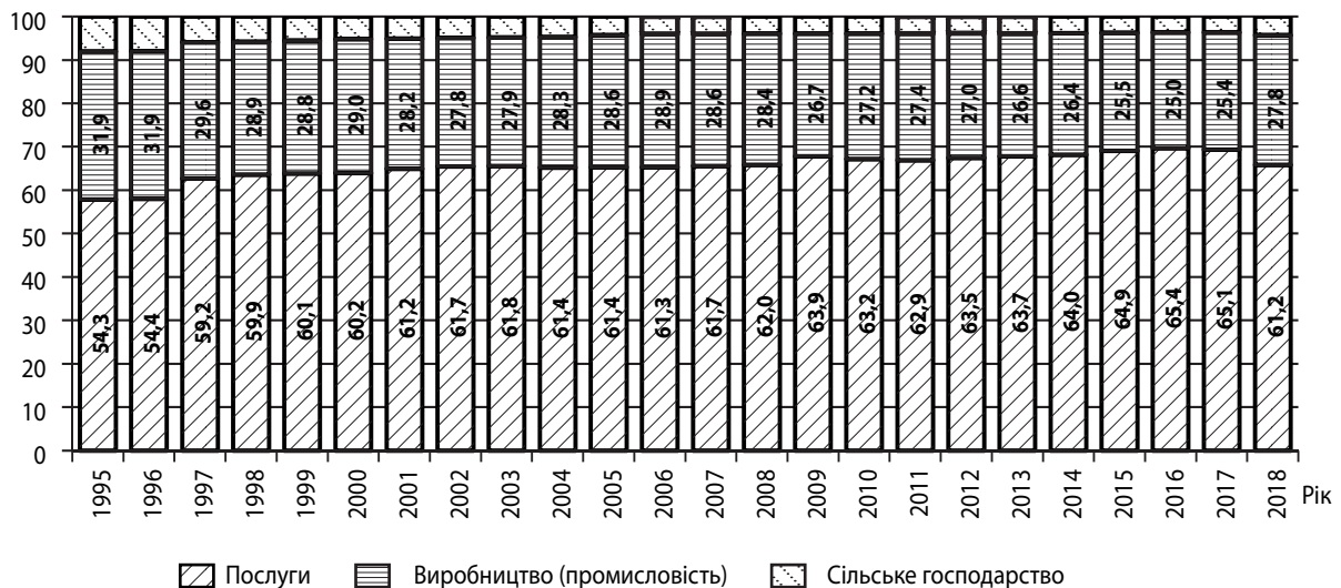
Рис. 1. Частка секторів економіки у світовому ВВП, %