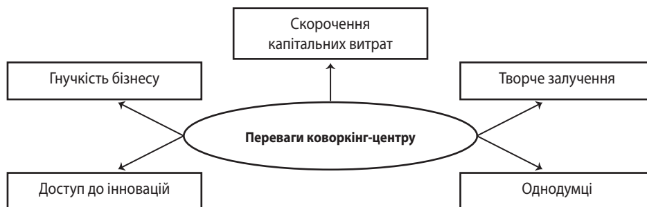
Рис. 1. Переваги роботи в коворкінг-центрі