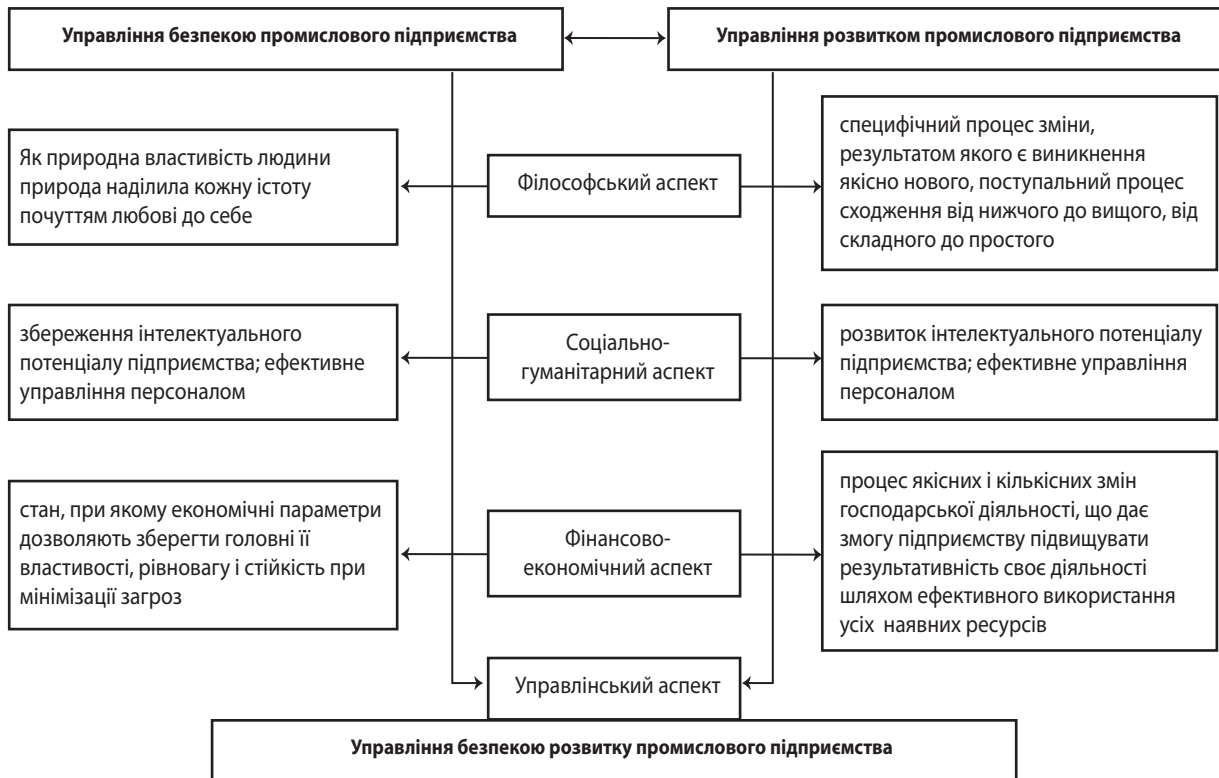
Рис. 1. Багатоаспектність управління безпекою розвитку промислового підприємства

до історичного та соціального підходів спостерігається в багатограних роботах К. Маркса. Особливістю його теорії стало визначення закономірностей економічного розвитку з позицій кожного суб'єкта класових відносин в суспільстві кінця XIX ст. – початку XX ст. Зміна устрою в суспільстві характеризує класові розбіжності у відносинах суб'єктів з виробництва, обміну, споживання та розподілу суспільного продукту. Відповідно до теорії Маркса клас буржуазії, який має у своїй власності засоби виробництва (заводи, фабрики, сировину, транспортні засоби та ін.), контролюють і вирішують долю пролетаріату, який на них працює.