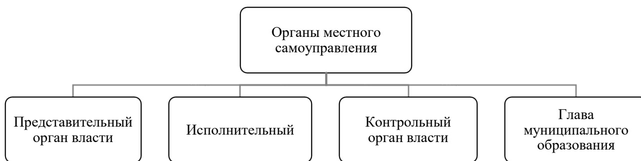
Рисунок 2. Структура местного самоуправления [7].

Для понимания назначения местного самоуправления необходимо знать основные функции, которые выполняет данный орган власти. В соответствии с Конституцией РФ местное самоуправление выполняет следующие функции: