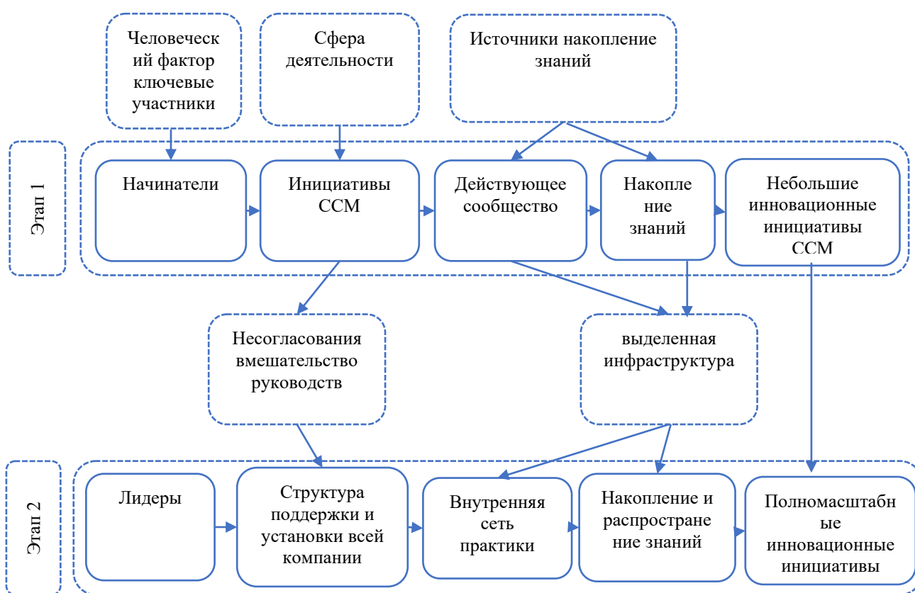
Рисунок 2. Модель процесса управления инновациями в промышленных организациях.

Инновационный менеджмент относится к созданию нового продукта, нового процесса, нового организационного или маркетингового метода. Это многомерная концепция, которая включает в себя знания, технологии, людей, видение, лидерство и организационную структуру. Чтобы добиться успеха, все измерения должны управляться соответствующими стратегиями. Компании должны быть открытыми для инновационных идей и должны создавать механизм, который начинается с продвижения человеческого ресурса. Поэтому административная структура должна быть построена таким образом, чтобы могла поддерживать новые идеи и инновационные тенденции. Кроме того, условия труда должны регулироваться соответственно (Рисунок 2).