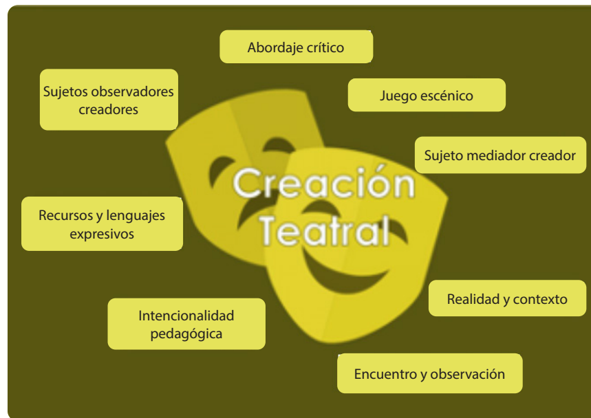
Figura 2: Dimensiones que intervienen en el proceso de la creación teatral

Para el sujeto mediador-creador, llevar a cabo el entrelazado de estas experiencias conducentes a la creación teatral debe representar, además, una oportunidad para crear una estrategia pedagógica innovadora que involucra un valioso proceso de observación y seguimiento de la creación artística, mediante una metodología flexible y libre. Esta metodología implica, a su vez, un acompañamiento para el desarrollo expresivo y pleno, que no solo se concreta con la puesta en escena, sino que se profundiza a través del abordaje crítico de la realidad representada. Como persona gestora del proceso, debe integrar las distintas dimensiones (Figura 2) que erigen la experiencia.