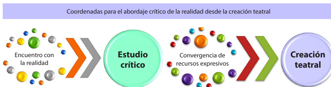
Figura 3: Coordenadas mediante las cuales se transita para poder plasmar aspectos de la realidad observada

Desde la dimensión pedagógica, la creación teatral no debe limitarse únicamente a la creación de un producto artístico. Debe concebirse como un espacio de convergencia o encuentro de diversas formas expresivas que proponen su propia metodología. Una serie de coordenadas y momentos ( Figuras 2 y 3 ), por los cuales se transita para plasmar, mediante los lenguajes escénicos, aspectos de la realidad o de un fenómeno social observado, y que se consideran esenciales para abordar desde una visión crítica.