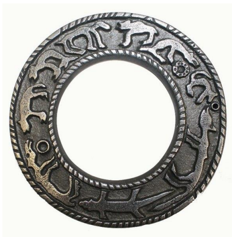
Рис. 3. Древний «Промысловый календарь» коми-пермяков (Коми, 2019)

1) Материальные источники – скульптура Параскевы Пятницы и (для сопоставления) более ранние коми-пермяцкие календари: всего их известно три (Врганесян, 2014: 97). Сложность сравнения состояла в том, что все предыдущие календари имеют кольцевой характер и зооморфные изображения (напр. Рисунок 3), а символы на «белом платке» расположены в виде пяти полос и выполнены графически. Однако среди исследуемых знаков также встречаются «кольцевые» изображения, совпадающие по принципам построения с более ранними календарями.