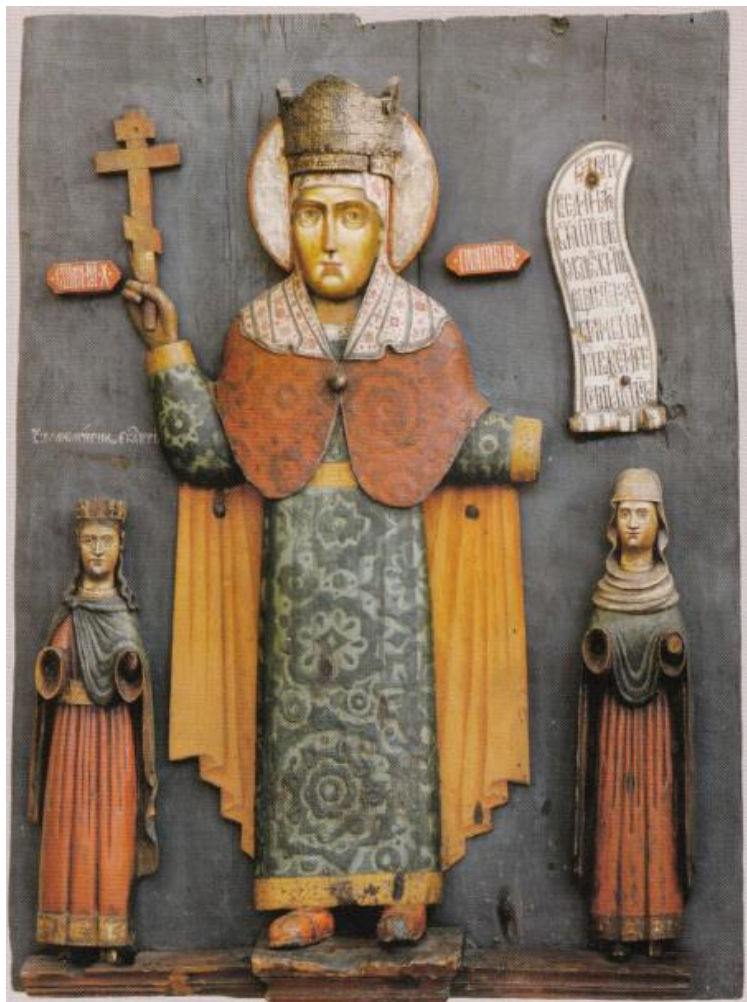
Рис. 1. Скульптура Параскевы Пятницы. XVII в. Пермская государственная художественная галерея. Постоянная экспозиция.

Календарь находится на одном из элементов православной скульптуры XVII в. с названием «Параскева Пятница с предстоящими великомученицами Екатериной и Варварой» (Рисунок 1) из коллекции Пермской деревянной скульптуры и представляет собой комплекс символов на «белом платке» (платке), покрывающем плечи и голову Святой. Наличие такого плата предусмотрено иконописным каноном: «...и святые великомученицы Парасковии нареченныя Пятницы, риза киноварь, испод лазорь, на главе плат бел, а в руке свиток...» (Цит по: Тихомирова, 2008: 223). Канон умалчивает о написании на «белом платке» каких-либо символов, поэтому можно утверждать, что они были нанесены по инициативе местного священника (или епархии) в соответствии с этническими традициями паствы.