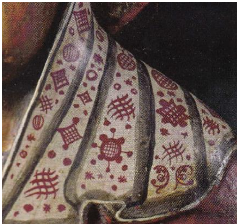
Рис. 2. Фрагмент календаря на «белом платке» Параскевы Пятницы

Цель статьи – проанализировать символы на белом платке Параскевы Пятницы из коллекции Пермской деревянной скульптуры в их взаимосвязи с регулированием рождаемости в коми-пермяцком обществе XVII в.