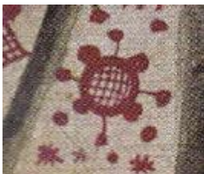
Рис. 4. Элемент календаря, обозначающий четырехлетний цикл

Принадлежность символов на «белом платке» Параскевы Пятницы к календарю определяется по двум признакам. Во-первых, наличие так называемых «четырёхчастных» элементов – кругов, разделенных на четыре равные части. В древних культурах это чаще всего означало четыре времени года, но для большинства народов Севера таких периодов было только два: холодный и теплый (зима и лето), причем зима доминировала, и возраст (годы) считался не по летам, а по зимам. Переход от зимы к лету (и обратно) делился на несколько микросезонов (Рындина и др., 2019: 145). В коми-пермяцкой культуре «четырёхчастный» символ (Рисунок 4) означал не четыре времени года, а цикл из четырех лет. На «белом платке» этот символ сочетается с крупными точками («солнцем»), которое находится высоко (лето) и низко (зима). Расположенные рядом «звездочки» также напоминают изображение «рваных» краев солнца, характерное для традиционных культур в целом и других коми-пермяцких календарей: там солнце изображалось в виде розетки с неровными краями (Вртанесян, 2014: 97).