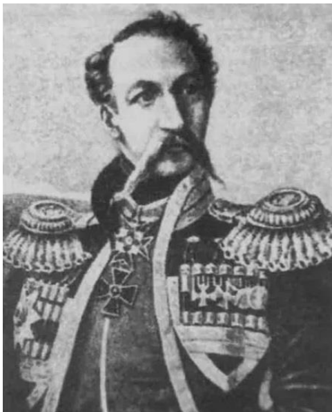
Рис. 1. Генерал Г.Х. Засс

В 1840 г. произведен в генерал-лейтенанты и становится начальником правого фланга Кавказской линии. В 1840–1841 гг. он приступает к строительству Лабинской линии, основывает ряд казачьих станиц и укрепленных постов между ними. Созданное им Арджинское укрепление было переименовано в Зассовское. В 1842 г. он покидает Кавказ.