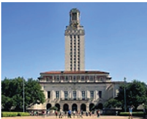
Slika 1. Univerzitet u Teksasu

Za dobijanje bečelor diplome potrebne su četiri godine školovanja i tokom tog perioda studenti slušaju predavanja o medijima, masovnim komunikacijama i medijskoj produkciji (McElroy, 2019). Predavanja pokrivaju i atletske aspekte sportova, poput kineziologije. Od studenata se traži i obavljanje stručne prakse da bi dobili bečelor diplomu. Za dobijanje master diplome iz sportskog novinarstva obično je potrebno dvije godine, a od studenata se traži da istražuju uticaj sporta na društvo iz sociološke perspektive. Studenti uče i istražuju o sportskom biznisu i ekonomiji, ulozi sporta u obrazovnom