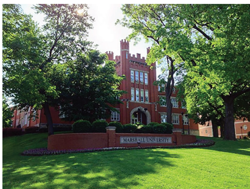
Slika 2. Univerzitet Maršal

sistemu i psihološkim aspektima sportova. Da bi stekli diplomu, studenti moraju napraviti projekat profesionalnog izvještavanja i takođe imaju mogućnost obavljanja stručne prakse. Prema podacima Nacionalnog centra za obrazovanje Amerike iz 2015/2016. godine najskuplja školarina je bila na Univerzitetu u Teksasu. Školarina za domaće studente je iznosila 9,806$, a za strane studente čak 34,676$. Najmanja školarina je bila na Univerzitetu Maršal, a iznosila je 6,814$ za domaće i 15,602$ za strane student (National Center for Education Statistics, n.d.).