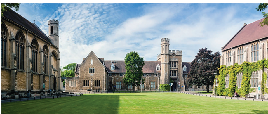
Slika 3. Univerzitet u Gločesterširu

of Lincoln, n.d). Na posljednjoj godini studija studenti imaju mogućnost da biraju između pisanja diplomskog rada ili produženog praktičnog rada, da bi diplomirali. Stručnjaci i iskusni sportski novinari iz BBC-a, The Sun-a, Sky Sports-a, The Daily Telegraph-a, itd. često gostuju na predavanjima i dijele iskustva sa studentima (University of Gloucestershire, n.d.). Školarina je otprilike ista na gotovo svim univerzitetima. Za domaće studente iznosi oko 9,000£, a za strane oko 15,000£.