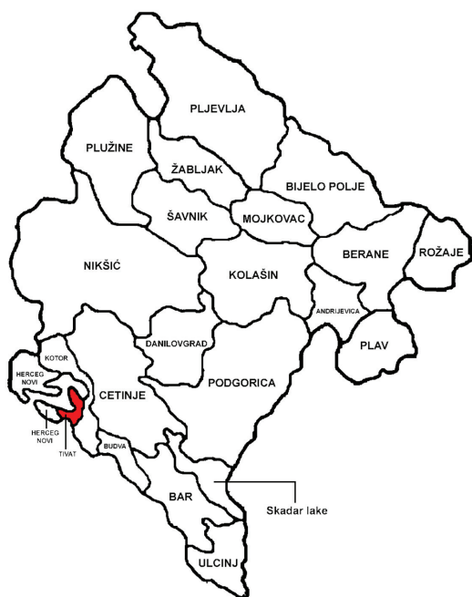
Slika 1. Teritorija Tivat

stanovništva bila je 38.0 godina, muškaraca 37.0, a žena 39.0 godina. Kada je u pitanju stanovništvo koje je naša ciljna grupa, a to su adolescenti, prema popisu bilo je nešto preko 900 stanovnika u opštini Tivat.