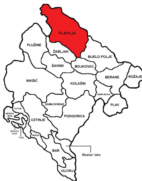
Slika 1. Opština Pljevlja na karti Crne Gore

Visinu tijela nije uvijek moguće precizno odrediti, posebno kod nekih slučajeva kao što su na primjer, paraliza, amputacija ili različiti deformiteti. Zbog toga se za određivanje visine koriste neki drugi pouzdani indikatori, kao što su dužina ruke i stopala, dužina tibije, visina koljena, dužina podlaktice, dužina grudne kosti, sjedeća visina, dužine lopatice, dužina ruke i