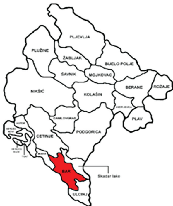
Slika 1. Geografska lokacija Bara u Crnoj Gori

nović, Petković, Jurak, & Grasgruber, 2012). Istraživanja koja svrstavaju Crnogorce još uvijek u najvisočiju naciju u Evropi (Pineau, Delamarche, & Bozinovic, 2005) su izazvala mnoge naučnike da veruju da u to, ali su Bjelica i njegovi saradnici (2012) svojim istraživanjem potvrdili da su Crnogorci veoma visoki, ali ne i najviši, sa prosječnom visinom 183.2 cm kod muškaraca i prosječnom visinom 168.37 cm kod djevojaka.