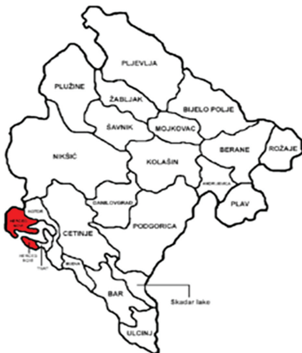
Slika 1. Geografska lokacija Herceg Novog u Crnoj Gori

južne regije (muškarci 182.55 cm, žene 168.76 cm) (Popović, 2017).