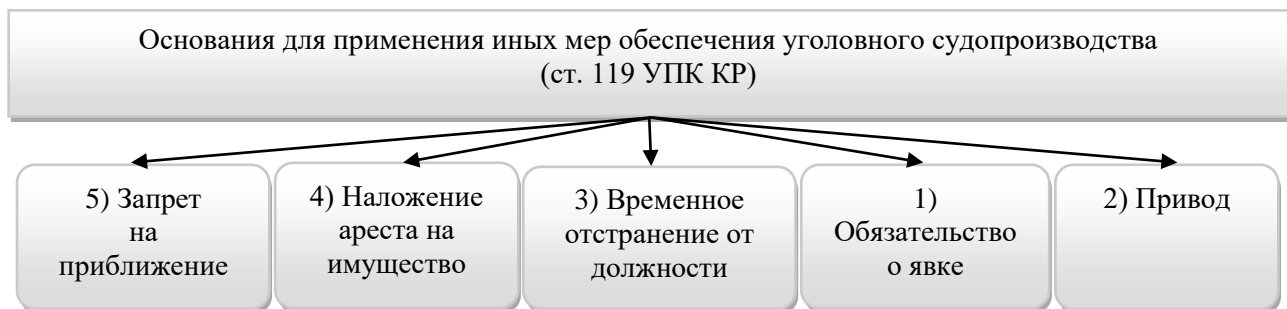
Рисунок 1.

В целях обеспечения предусмотренного УПК КР порядка ведения досудебного и судебного производства, надлежащего исполнения приговора орган, ведущий уголовное судопроизводство, вправе применить к подозреваемому, обвиняемому меры обеспечения уголовного судопроизводства (Рисунок 1).