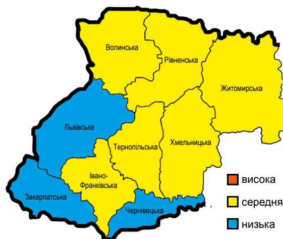
Рис. 4. Напруженість епізоотичної ситуації зі сказу у північних та західних областях України за 2014–2016 рр. Fig. 4. Tension of the epizootic situation in the northern and western regions of Ukraine for 2014–2016