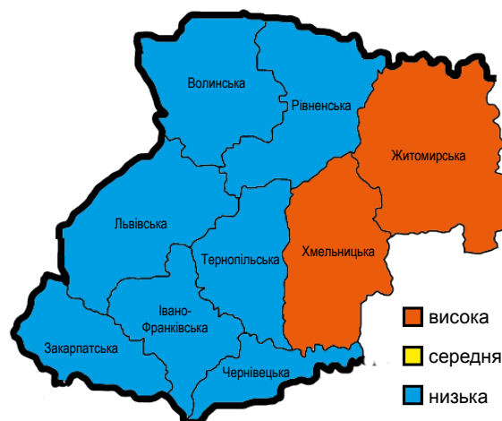
Рис. 2. Напруженість епізоотичної ситуації зі сказу у північних та західних областях України за 2008–2010 рр. Fig. 2. Tension of the epizootic situation in the northern and western regions of Ukraine for 2008–2010