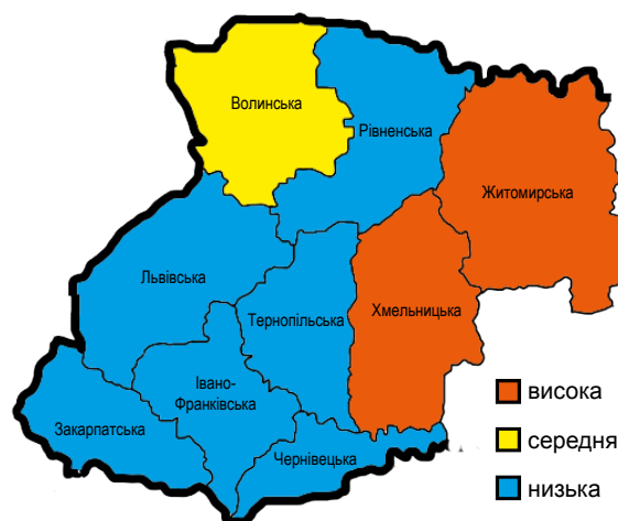
Рис. 3. Напруженість епізоотичної ситуації зі сказу у північних та західних областях України за 2011–2013 рр. Fig. 3. Tension of the epizootic situation in the northern and western regions of Ukraine for 2011–2013