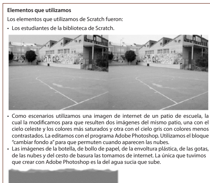
Figura 2: Creación de objetos y escenarios. Múltiples estrategias.

Por otra parte, se observa que los objetos y escenarios en su mayoría no han sido elaborados por los grupos participantes. Son excepciones el grupo 1, que creó uno de sus objetos en otro programa de edición de imágenes y el grupo 2 que utilizó como escenarios fotos tomadas por las participantes en la escuela. Sin embargo, la estrategia de reutilizado de creaciones elaboradas por otras personas se observa en todos los grupos, ya sea para los objetos, fondos o ambos. En este sentido, maestros y maestras recurrieron a las bibliotecas de Scratch o tomaron imágenes alojadas en internet para ilustrar sus personajes y escenarios. El grupo 1 en su informe final señalaba esta situación, mostrando en este caso una conjugación de fuentes que se articularon para la creación de objetos y escenarios, como muestra la Figura 2 :