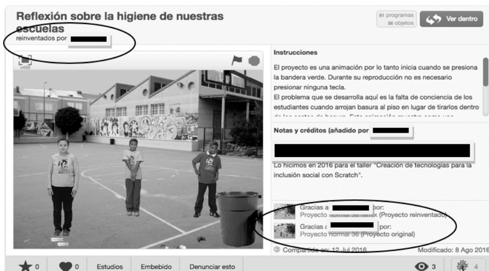
Figura 3: Re-inversiones de proyectos.

En líneas generales, los grupos utilizaron tanto la mochila como la reinención como estrategias para compartir los proyectos o algunas de sus partes entre integrantes del grupo, como se observa en la Figura 3 :