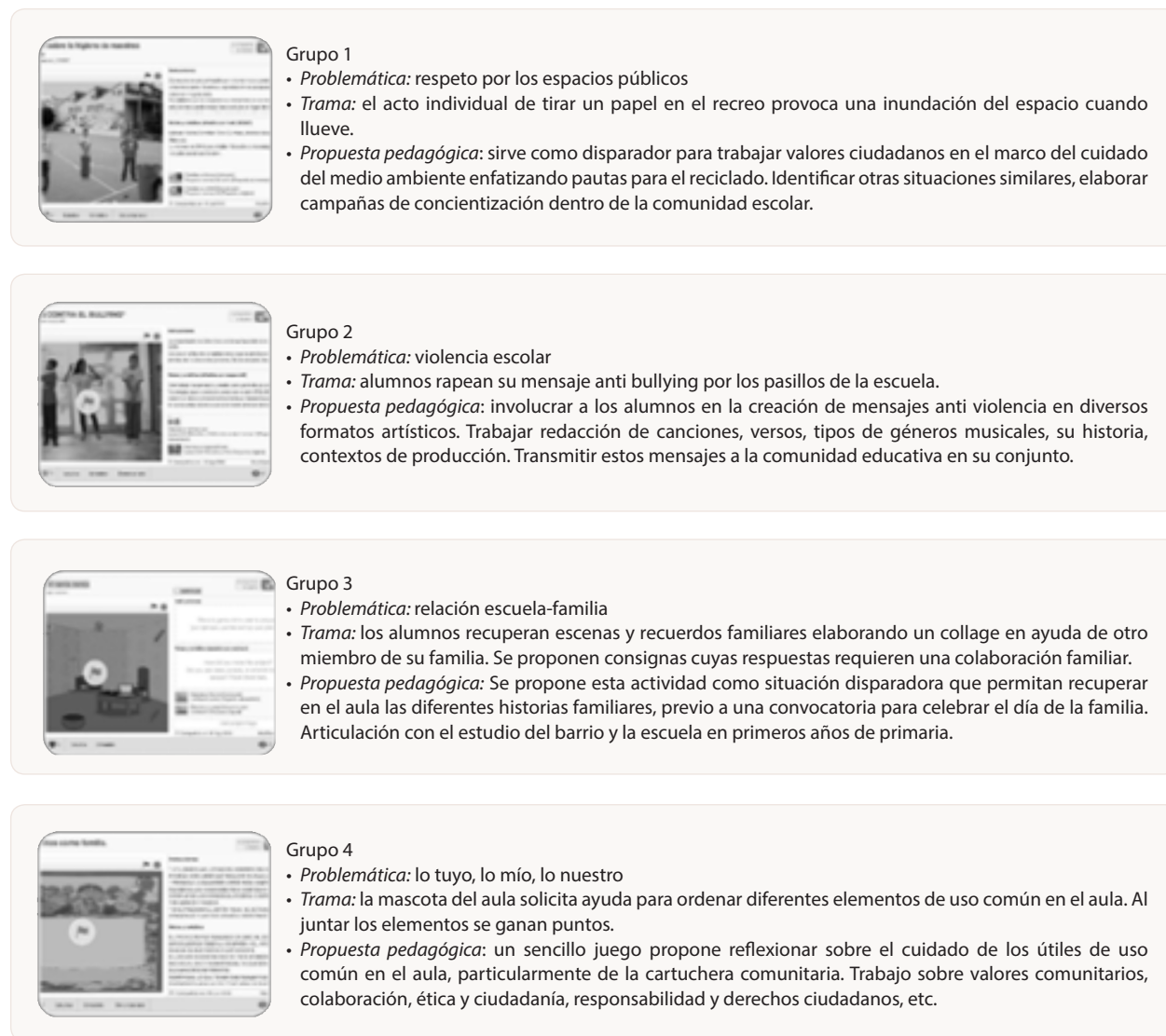
Figura 6: Características de las tecnologías para la inclusión social creadas en el marco del taller.