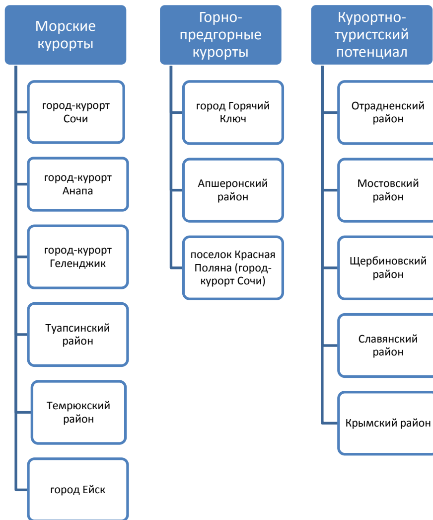
Рис. 2. Курорты Краснодарского края

активность отмечается в Краснодаре и Новороссийске. Курорты Краснодарского края представлены на рисунке 2.