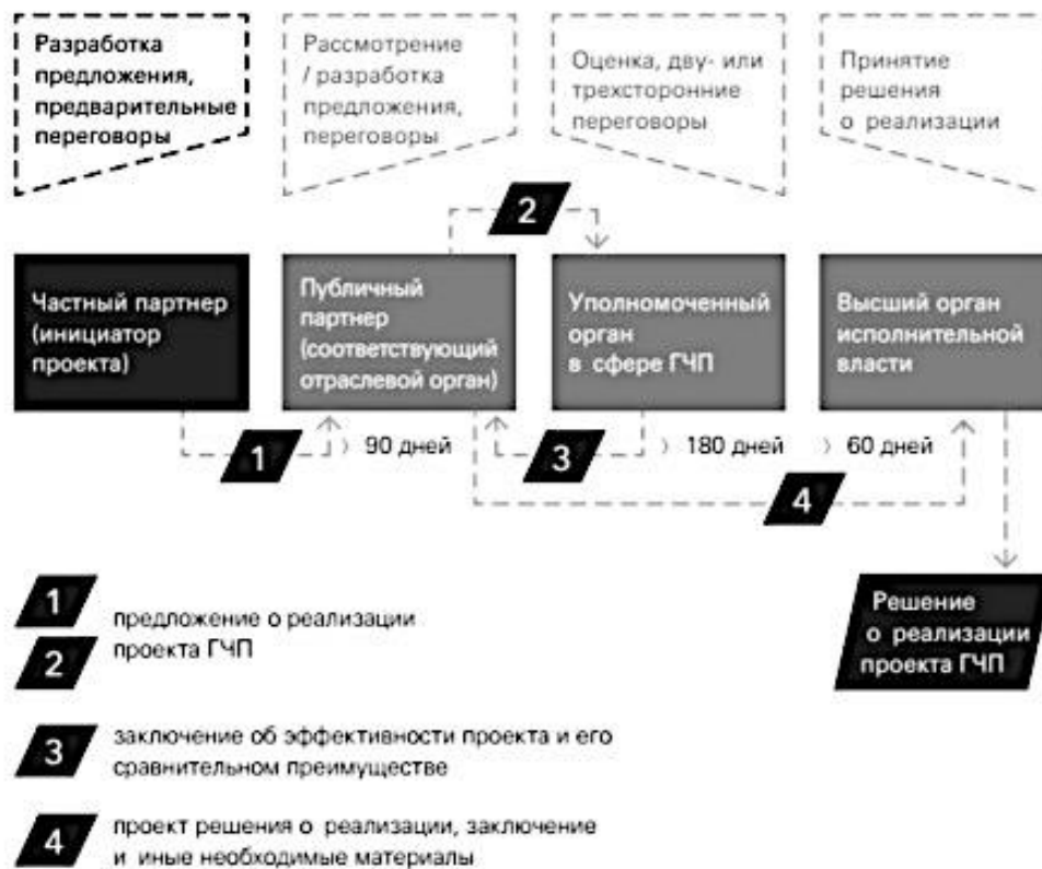
Рис. 4. Схема рассмотрения проекта ГЧП [13]

На рисунке 4 показана последовательность рассмотрения проектов ГЧП.