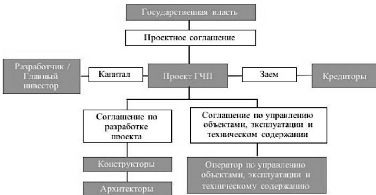
Рис. 3. Схема реализации проектов ГЧП в Канаде [7]

Схема работы по ГЧП в Канаде приведена на рисунке 3.