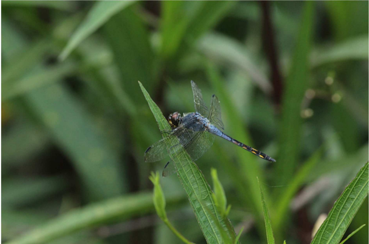
圖三、近於水平停棲的溪神蜻蜓雄蟲