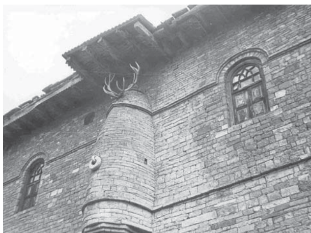
Рис. 7. Стена минарета мечети в селе Гочоб в Дагестане.

Однако, пожалуй, в наиболее ярком виде древние верования, связанные с образом быка, сохранились в горных районах Грузии (Сванетия). Этот зверь имел большое значение в системе заупокойных представлений. В поминальные дни, известные под названием Лапана ликдал, самой почетной жертвой был бык. Бычка ставили возле гроба покойника, зажигая на его рогах пару свечей 97 .