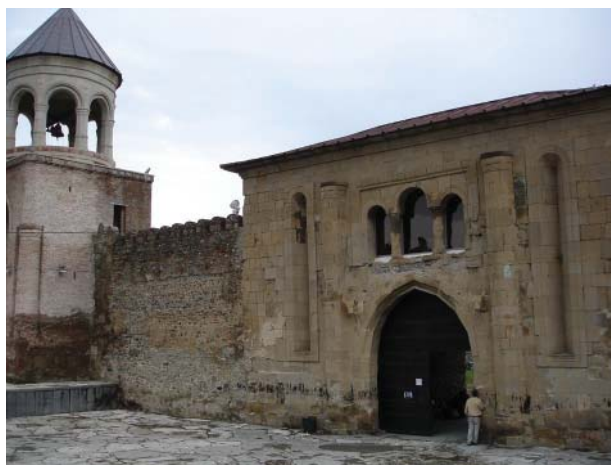
Рис. 1. Монастырь Мцхета.