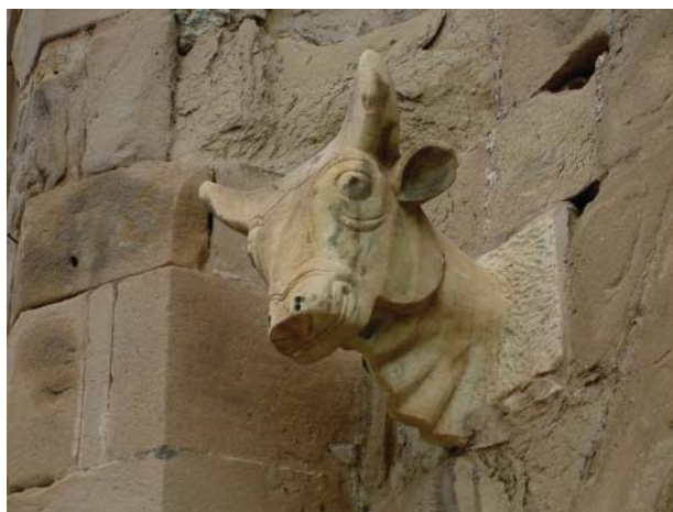
Рис. 2. Входные ворота монастыря Мцхета.

восточном фасаде храма Свети-Цховели в Мцхета 20 (XI в.) (рис. 1, 2). Как известно, долгое время этот собор являлся главной христианской святыней Грузии 21 . Интересно, что в этом месте букраний появляется еще раз. Так, над входными воротами, прорезывающими массивную кирпичную стену вокруг собора (относится к тому же времени), он представлен дважды. В данном случае бык показан достаточно реалистично: большие круглые глаза по обе стороны головы и поднятые вверх рога в форме полумесяца.