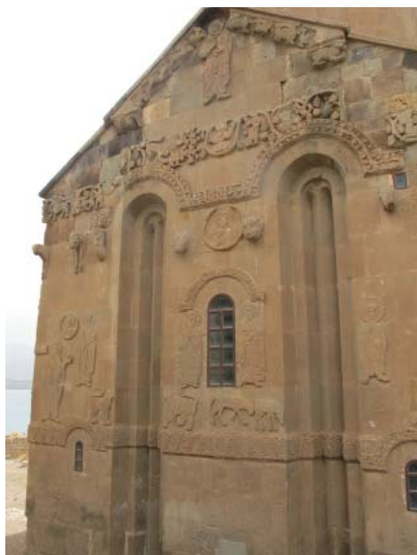
Рис. 3. Собор Святого Креста на о. Ахтамар.

тамар (X в.) 22 , есть бык (рис. 3). К сожалению, характерные для этого зверя рога плохо сохранились.