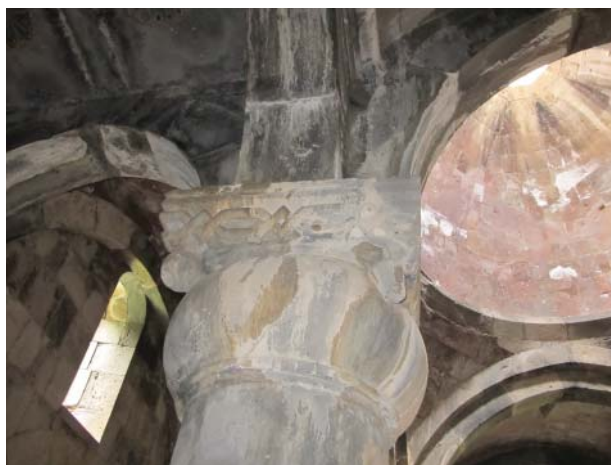
Рис. 5. Капитель колонны гавита. Монастырь Санаин, Армения.

мотив представлен над аркатурно-колончатый поясом. Рога в виде полумесяца не позволяют ошибиться в идентификации животного. В непосредственной близости от него представлен сосуд, наличие которого может, вероятно, восприниматься как аллюзия на идею жертвенности. В таком же соседстве бычья голова появляется несколько раз и на капителях колонн, поддерживающих своды гавита (кон. XII в.) 24 в монастырском комплексе Санаин (рис. 5). В этом же здании интересующий нас мотив появляется еще раз в пролете щелевидного окна (рис. 6). Как и в предыдущих случаях, рога в виде полумесяца однозначно свидетельствуют в пользу идентификации зверя.