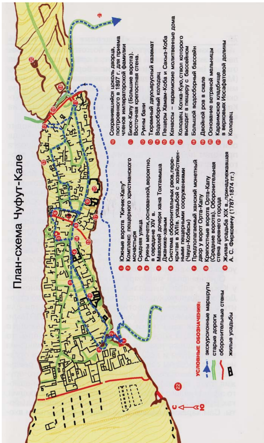
Рис. 1. План-схема застроенной части Чуфут-кале