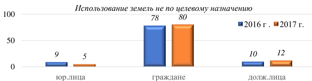
Рисунок 2. Наиболее частые виды нарушения.

Анализируя статические показатели государственного земельного надзора за 2016–2017 г. на территории Новосибирской области, авторами отмечается ежегодное увеличение проведенных проверок соблюдения земельного законодательства и количества выявленных нарушений. Показатели осуществления государственного земельного надзора представлены на Рисунках 3–4.