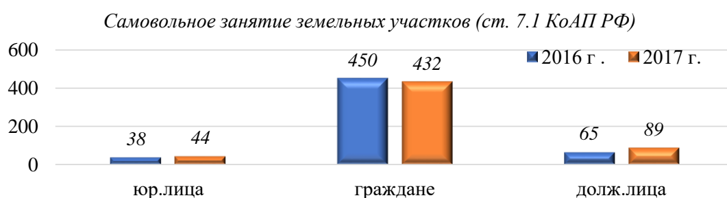
Рисунок 1. Наиболее частые виды нарушения.

Авторами проведен мониторинг результатов проверок за 2016 и 2017 года и представлены наиболее частые виды нарушения. Результаты таких проверок представлены на Рисунках 1–2.