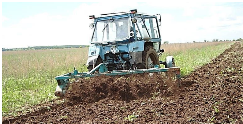
Рисунок 3. Почвообрабатывающее орудие ОВПП-2,4

Более совершенной моделью роторных почвообрабатывающих машин является почвообрабатывающее орудие ОВПП-2,4 (Рисунок 3).