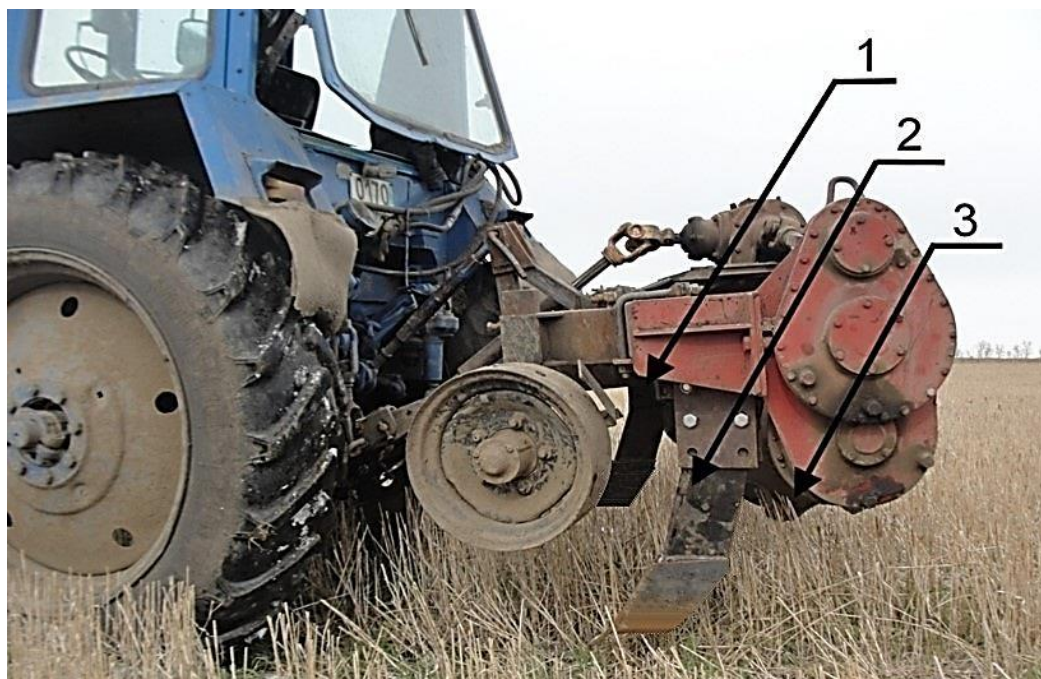
Рисунок 4. Комбинированная почвообрабатывающая машина: 1 – правый почвоуглубитель; 2 – левый почвоуглубитель; 3 – ротор

Для решения задачи снижения нагрузки на механизм вала отбора мощности трактора без снижения производительности машинно-тракторного агрегата, разработано принципиально новое техническое средство для основной обработки почвы с одновременной заделкой органической массы сидератов и пожнивных остатков (Рисунок 5).