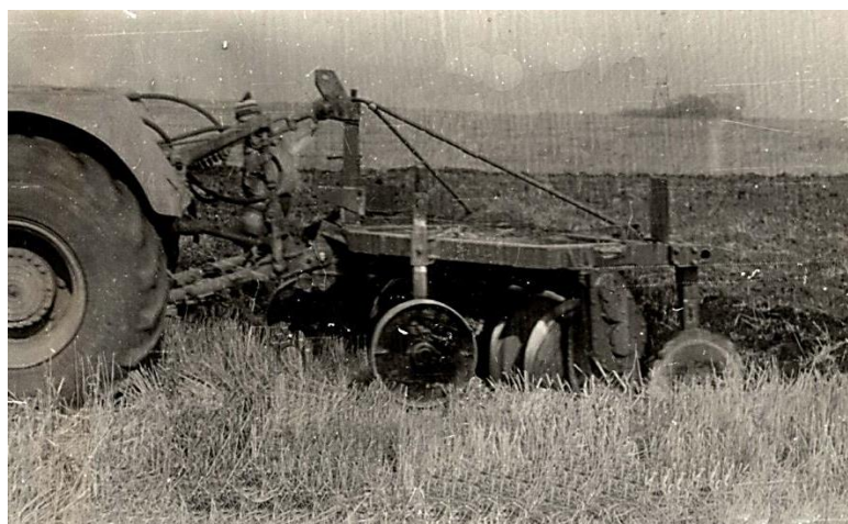
Рисунок 2. Навесной роторный плуг ПРН-2,2 в агрегате с трактором Т-150К

Навесной роторный плуг — ПРН-2,2 разработан для трактора класса 3 (Рисунок 2). Результаты функциональной проверки этой модели при проведении основной обработки почвы и разделке глыбистой зяби показали, что он обеспечивает выполнение агротехнических требований к основной обработке почвы на скорости до 10 км/ч.